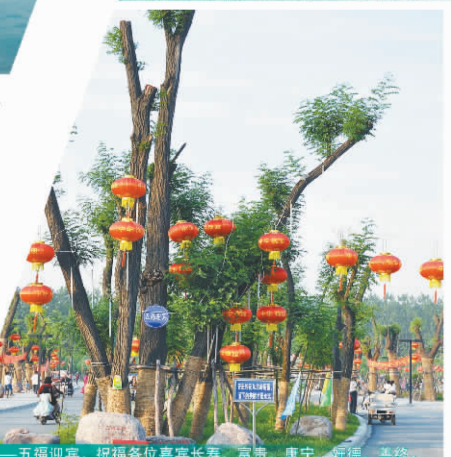
奇槐——五福迎宾，祝福各位嘉宾长寿、富贵、康宁、好德、善终。