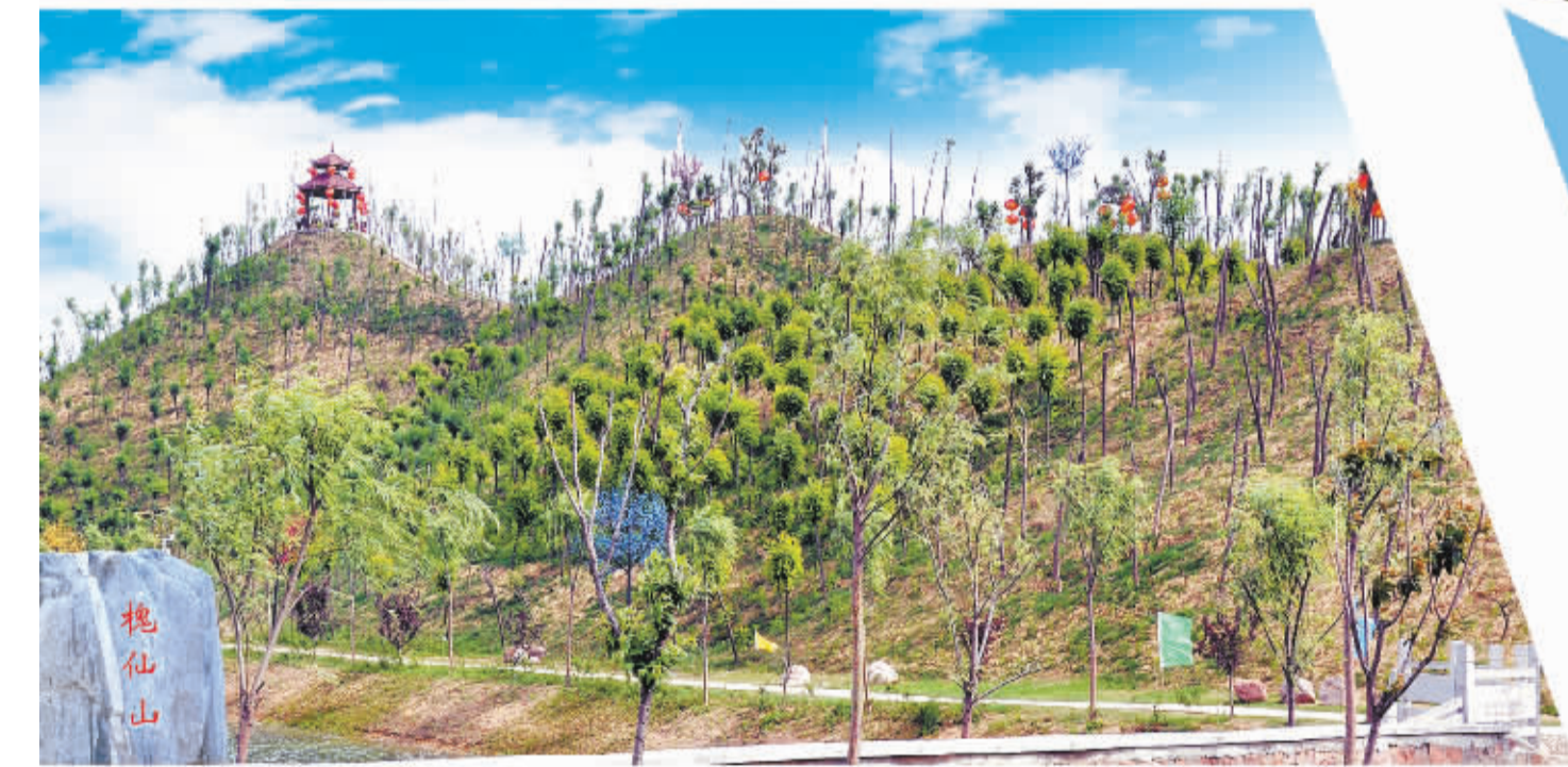
槐仙山上观槐亭，遍山槐树创生态。