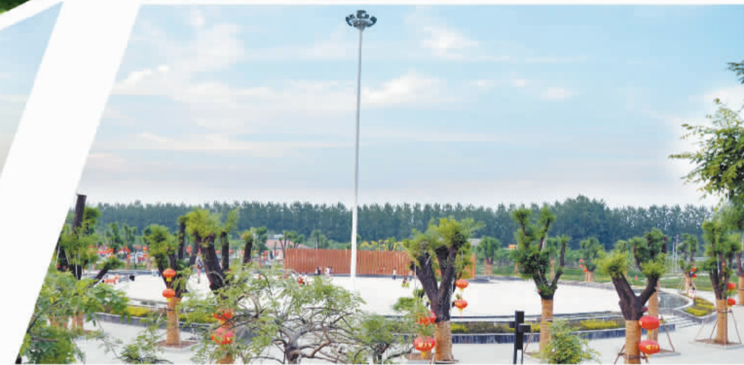
广场上，国学经典《千字文》石音地画韵味悠长。