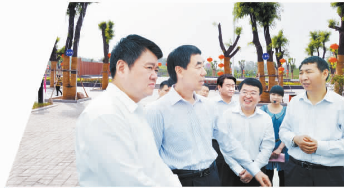
副省长王铁在市领导徐光、岳文海、沈丘县委书记蔡从创陪同下视察中华槐园。