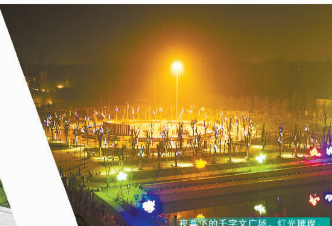
夜幕下的千字文广场，灯光璀璨。