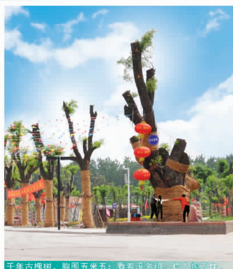
千年古槐树，胸围五米五；看着没多粗，仁人德厚。