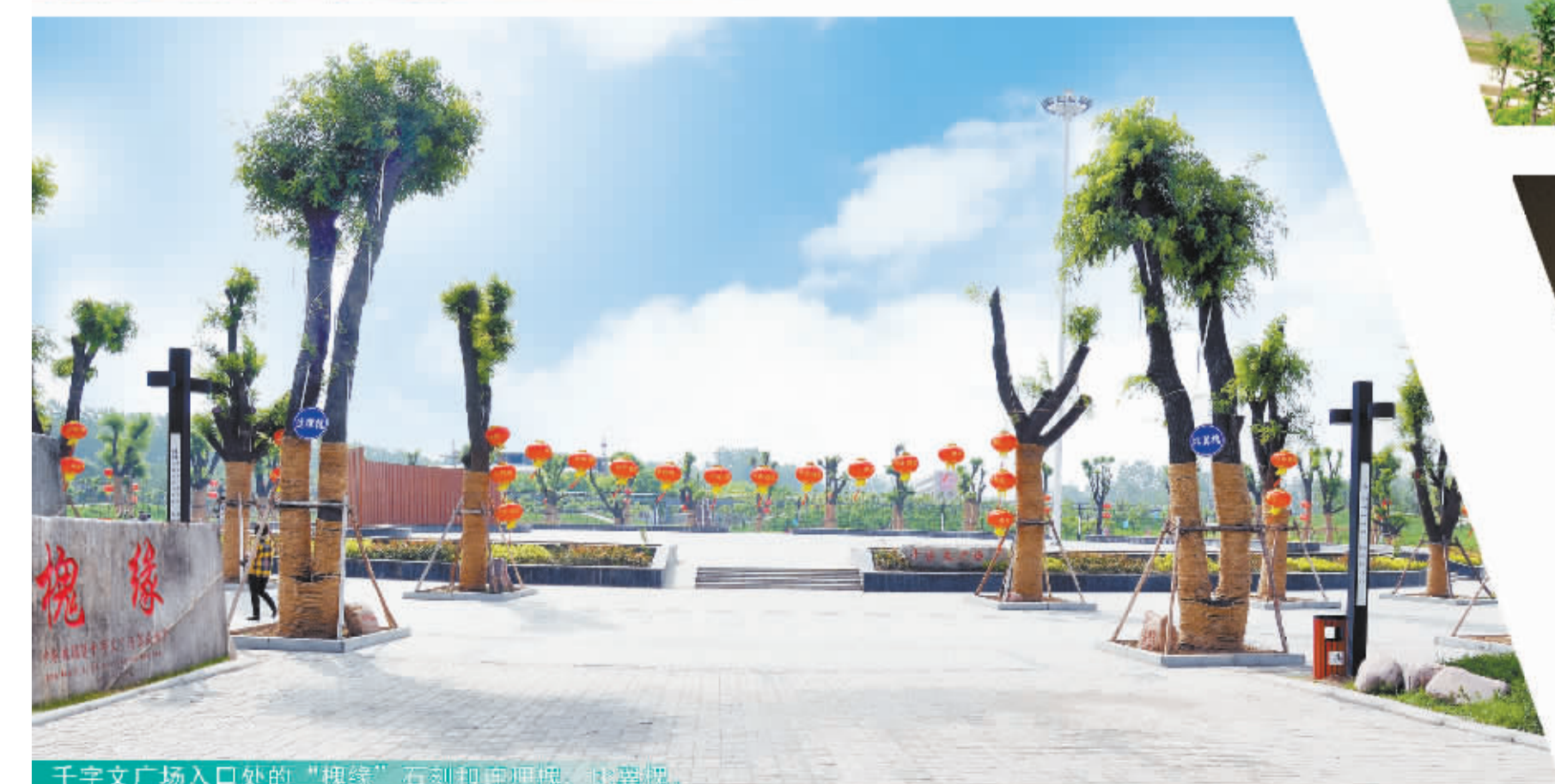
千字文广场入口处的“槐缘”石刻刻碑埋地，让树成林。