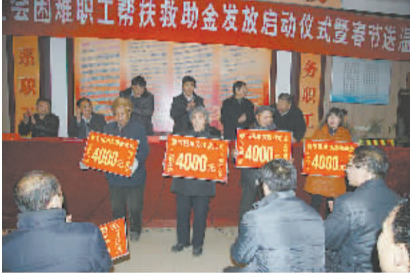
困难职工帮扶救助金发放启动仪式暨春节送温暖