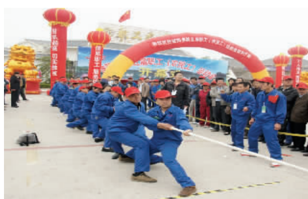
拔河比赛如工作一样卖劲

过去的一年，淮阳县各级工会组织在县委和市总工会的正确领导下，以邓小平理论和“三个代表”重要思想为指导，全面贯彻落实科学发展观，认真学习贯彻落实党的十七届六中全会、省九次党代会和淮阳县十一次党代会精神，围绕中心，服务大局，努力拼搏，扎实工作，圆满完成了各项工作任务，被省总工会评为“六好县总工会”、“全省工会全民健身周活动先进单位”，并获得“省级卫生先进单位”、“市级文明单位”、2011年度“全市工会工作先进单位”等称号。