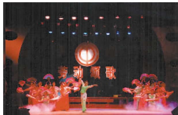
精彩纷呈的文娱活动丰富了广大职工的文化生活