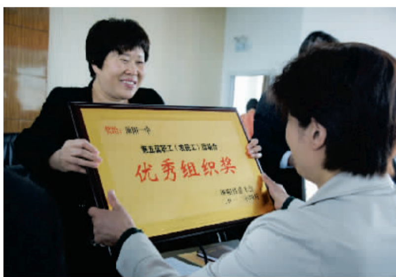
县长胡景旭为职工运动会优胜者颁奖