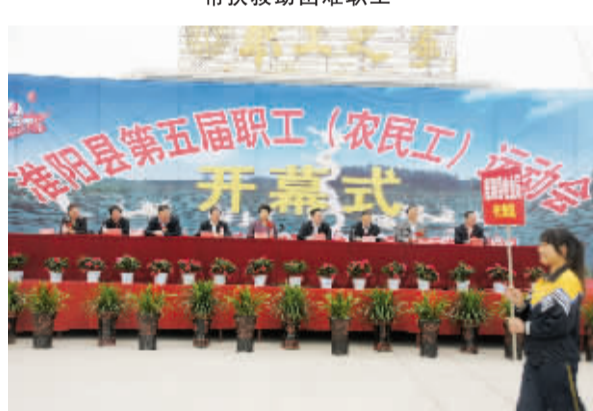
淮阳县第五届职工运动会开幕