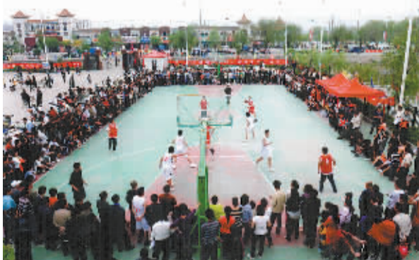
篮球赛展现出广大职工的精气神