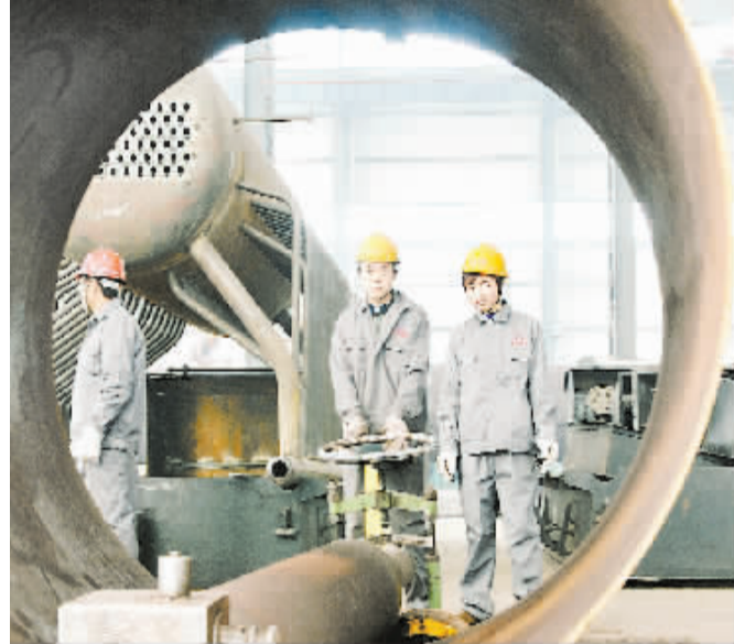
锅炉生产 中原荷能

整优化升级为重点,突出抓技改、调结构、降消耗、保环境,效果明显。全市120多家企业进行了技术改造,60家企业通过合作、参股、兼并等方式,与省内知名企业合作了战略重组,有力推进了产业结构调整和优化升级。