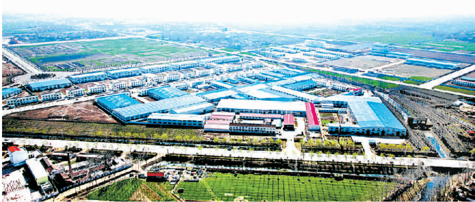
蓬勃发展中的产业集聚区

5~10亿元以上企业29家,财富、辅仁跻身中国民营企业500强,龙源纸业成为全省最大的A级瓦楞纸生产基地。