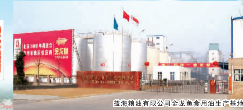
益海粮油有限公司金龙鱼食用油生产地