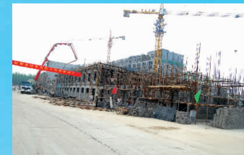
五得利三期项目建成后将成为世界单体最大面粉加工企业