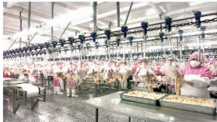
周口大用邦杰食品有限公司年屠宰1亿只鸡生产车间