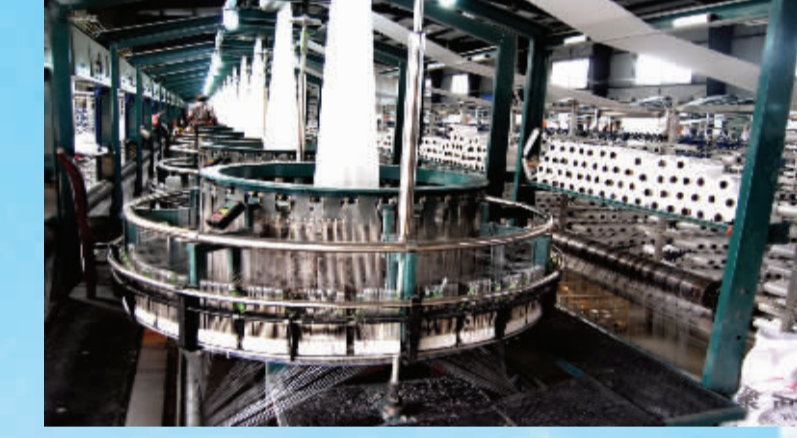
新华正彩印包装有限公司生产车间