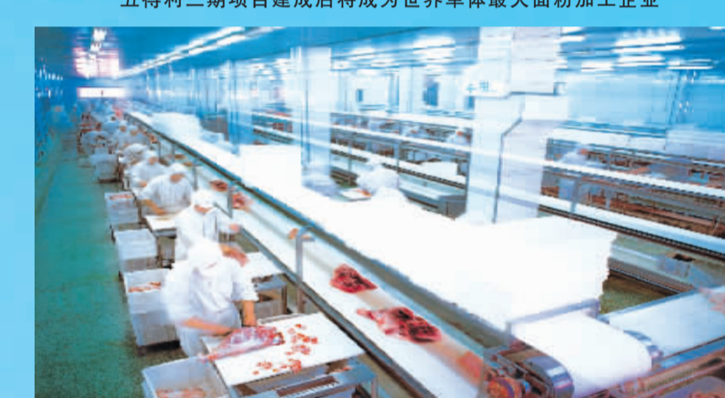
雨润集团周口景鹏有限公司年屠宰300万头生猪生产车间