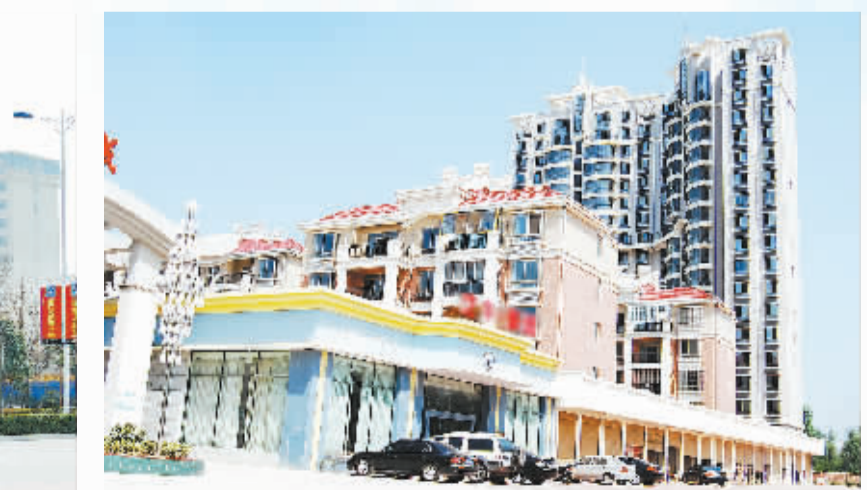
正在建设中的城市社区

2011年,品牌建设喜讯频传,益海粮油周口有限公司被省政府评为“2011年度百强企业”;周口鲁花浓香花生油有限公司荣获“2011年度周口市市长质量奖”;河南省科信电缆有限公司被省政府评为“2011年度高成长性百高企业”,被省信行评为“河南省高新技术企业60强”;被市政府评为“2011年度周口市质量管理工作先进单位”。近日,五得利集团周口面粉有限公司和周口大河林业