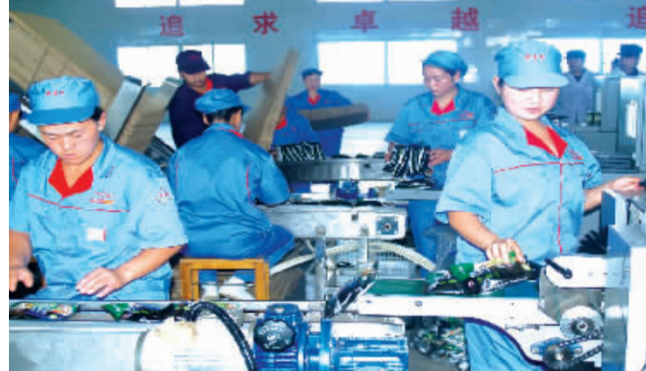
斯美特食品有限公司日生产20万包方便面生产车间