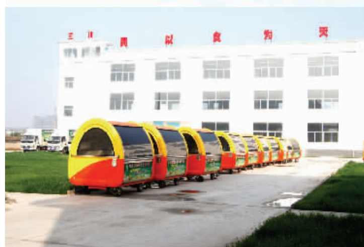
三川食品有限公司城市放心早餐工程生产车间

这是一片生机勃勃的土地!道路纵横,厂房林立,机器轰鸣,塔吊高耸,处处生机勃勃,步步赏心悦目……如今,走到周口经济开发区的每一位投资者,都会被这里如火如荼的生产建设场面和奋发向上、干事创业的热忱所感染。