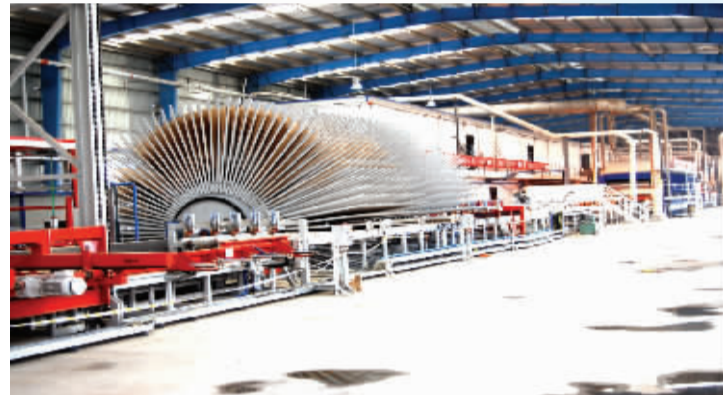
周口大河林业年产22万方纤维板生产车间