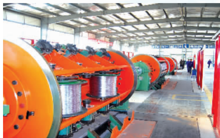
河南科信电缆有限公司碳纤维倍容导线生产车间