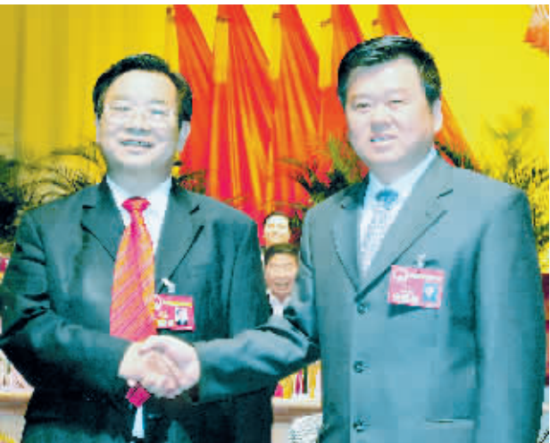
市委书记徐光与新当选的市人大常委会主任李洪民亲切握手。