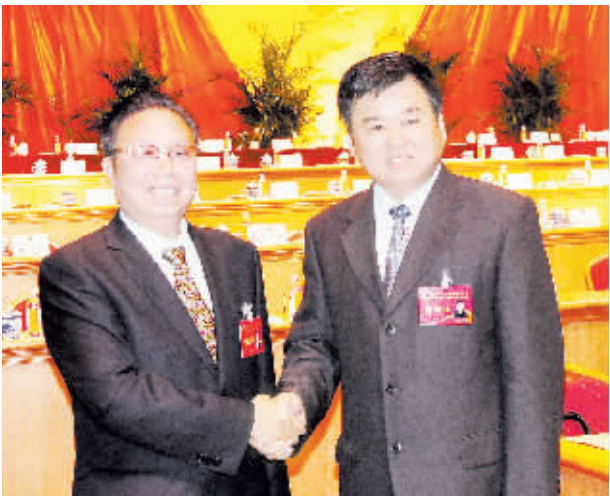
市委书记徐光与新当选的市政协主席穆仁先亲切握手。