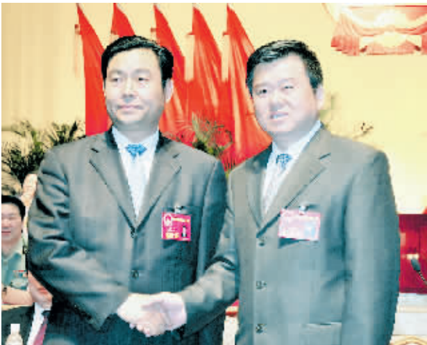
市委书记徐光与新当选的市人民政府市长岳文海亲切握手。