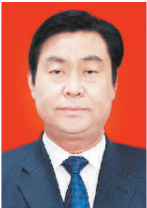
市人民政府市长岳文海

岳文海，男，汉族，1958 年 1 月生，河南桐柏人，大专学历，经济学硕士，1984 年 7 月加入中国共产党，1976 年 9 月参加工作。 1976.09—1981.09 桐柏县月河公社徐寨大队学校负责人、生产队长、村民兵连长、大队团支书 1981.09—1983.07 唐河师范学校学习 1983.07—1984.08 桐柏县回龙乡党办干事 1984.08—1986.07 河南农