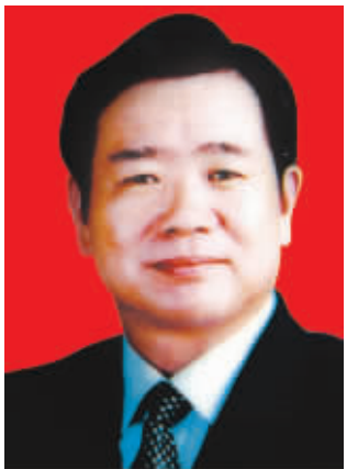
市人大常委会主任李洪民

李洪民，男，汉族，1951 年 10 月生，河南新蔡人，省委党校大专学历，1971 年 4 月加入中国共产党，1972 年 7 月参加工作。 1972.07—1980.08 新蔡县佛阁寺公社干部、团委书记 1980.08—1981.04 新蔡县佛阁寺公社党委副书记 1981.04—1984.03 新蔡县佛阁寺公社革委会主任、砖店公社党委书记 1984.03—1986.08 新蔡县委常委、办公室主任(1984.09—1986.07 在河南省委党校党政领导干部大专班