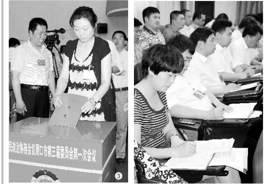
两会掠影 ① 交换意见。 ② 认真听会。 ③ 履行职责。 ④ 审议报告。 ⑤ 举手表决。