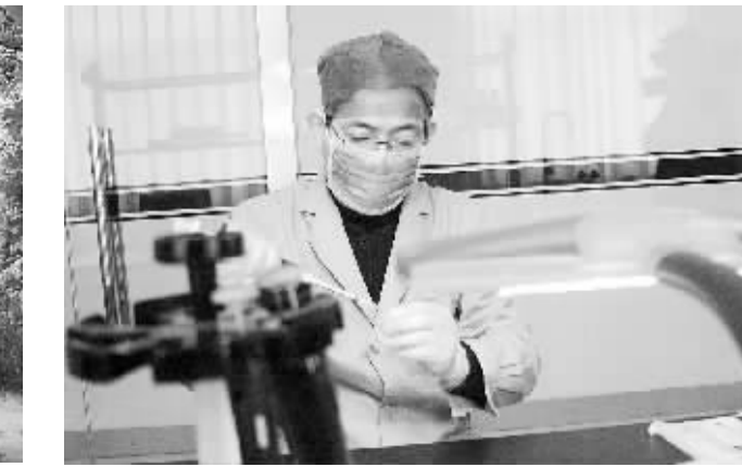
刑事技术民警对提取的现场物证认真检验。(资料图片)