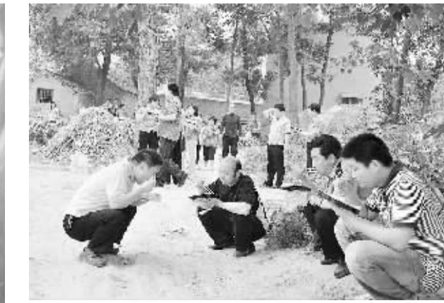
吃住在命案案发现场,对广大公安民警来说是家常便饭。