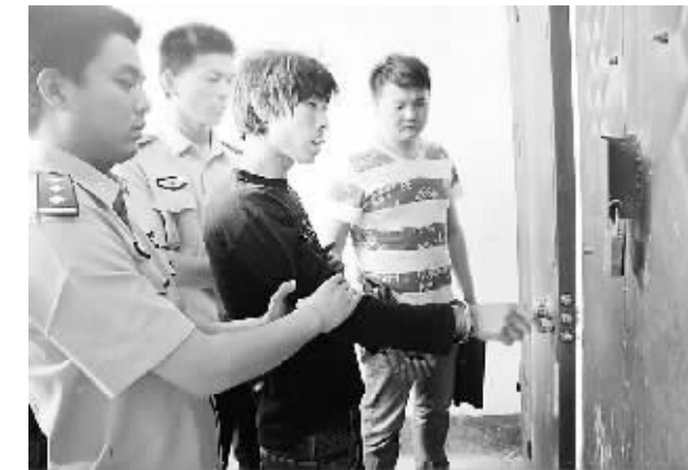
太康“5-14”强奸杀人案犯罪嫌疑人指认作案现场。