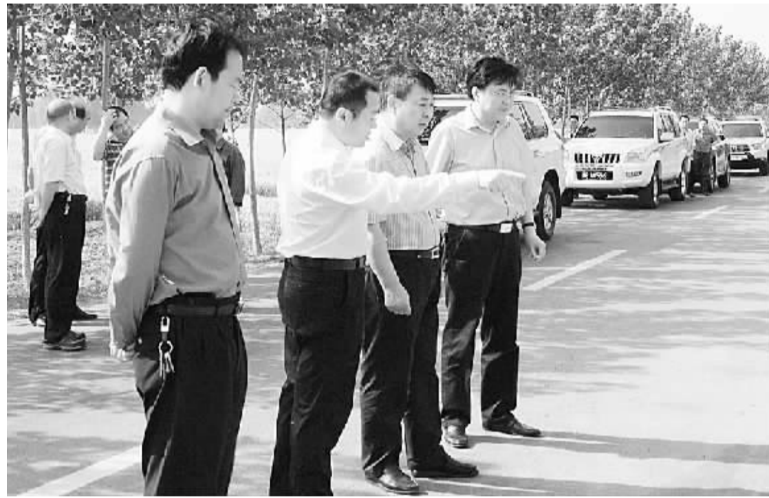
省公安厅党委委员、巡视员孙永福(右二),刑侦总队总队长李法正(右一)在周口指导命案侦破工作。

截至5月底,全市今年新发31起现行命案全部破获,破案率100%,发案数较去年同期下降11.43%,破案率较去年同比提升11.43个百分点,郟城、鹿邑、淮阳、项城、沈丘、太康、扶沟、西华8个县市公安局及城区文昌派出所、荷花路派出所现行命案发一破一,商水县公安局、城北派出所、金海路派出所、太昊路、七一派出所、泛区派出所辖区未发命案。同时,侦破往年命案积案3起,破获外省命案1起,抓获外省命案逃犯4人。为此,河南省公安厅先后三次致电祝贺。在现行命案全破的带动下,全市各项公安工作更加主动从容,“中原卫士杯”竞赛各项成绩全省位次明显前移。前五个月,全市公安机关共起诉犯罪嫌疑人1202人,较2011年同比提升23.5%,破获各类刑事案件1896起,打掉犯罪团伙65个,全市的社会治安大局更加持续稳定。