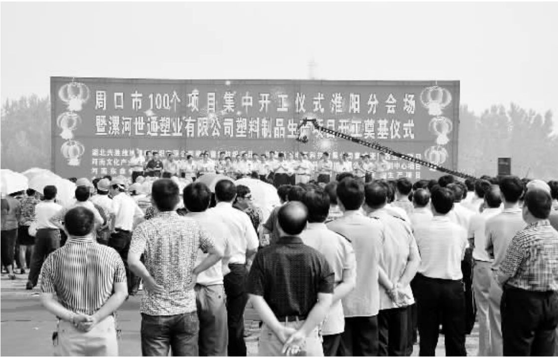
图为开工仪式现场。

本报讯 （记者 侯俊豫 通讯员 黄志坤 赵駿）6月18日，作为全市100个项目集中开工的重要组成部分——漯河世通塑业、河南东鑫钢构、文化旅游综合服务体等8个