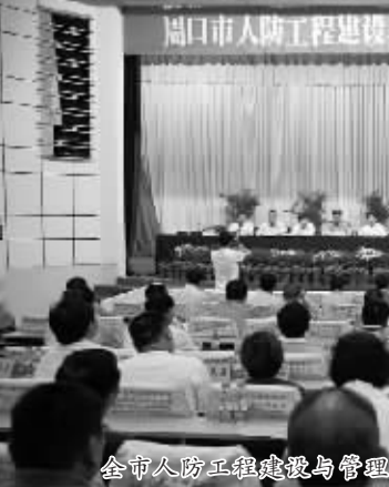
全市人防工程建设和管理工作西华现场会胜利召开

本报讯(记者雷明辉 通讯员刘保良)日前,记者从西华县人防办获悉,该县人防办始终坚持人防