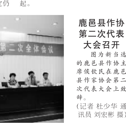
鹿邑县作协第二次代表大会召开。

有关规定,建立健全广告业务的承接登记、审核、档案管理制度,便于社会监督。 同时,该局还充分发挥12315投诉举报电话作用,积极受理投诉举报。 目前,该局已出动执法人员80人次,查处违法发布招生广告、招生简章、资料及广告用具120余份,摘除违法招生广告牌2处,横幅20条,张贴的宣传海报20余处。