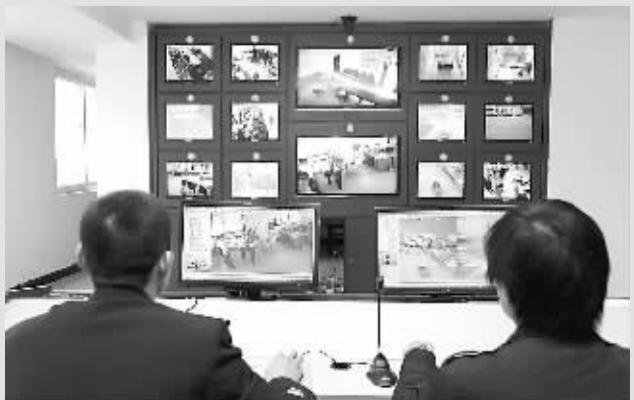
网上监控中心对全市公安机关各基层单位进行网上督察。