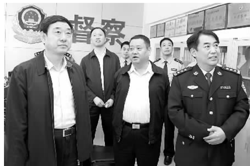
省公安厅党委委员、纪委书记姚继周(左一)在市政府党组成员、市公安局局长姚天民、市公安局副局长、纪委书记杨杰的陪同下,莅临市公安局警务督察支队调研指导工作。