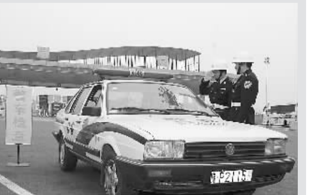
警务督察民警深入一线督察警车使用情况。