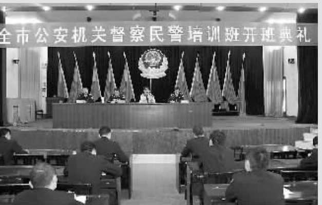
组织警务督察民警定期培训业务知识。