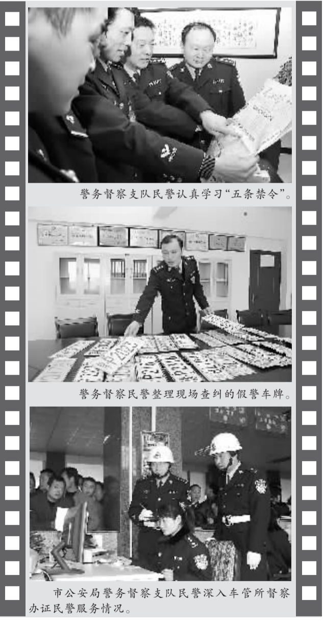
警务督察支队民警认真学习“五条禁令”。