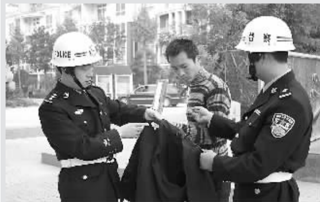
现场查纠仿造的假警服。