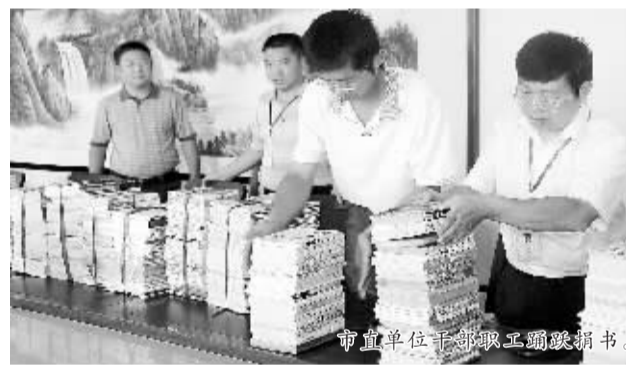
市直单位干部职工踊跃捐书。

育局20000册,川汇区委宣传部8000册,市人社局7500册,周口供电公司30000多册,河南省漯界高速公路有限责任公司18000册,市地税局14000册……他们把爱心融入书刊里,又把文明传递出去。我们可能记不住他们每个人的名字,但他们在用相同的行动汇成共同的口号——让书香伴随爱,撒满周口。