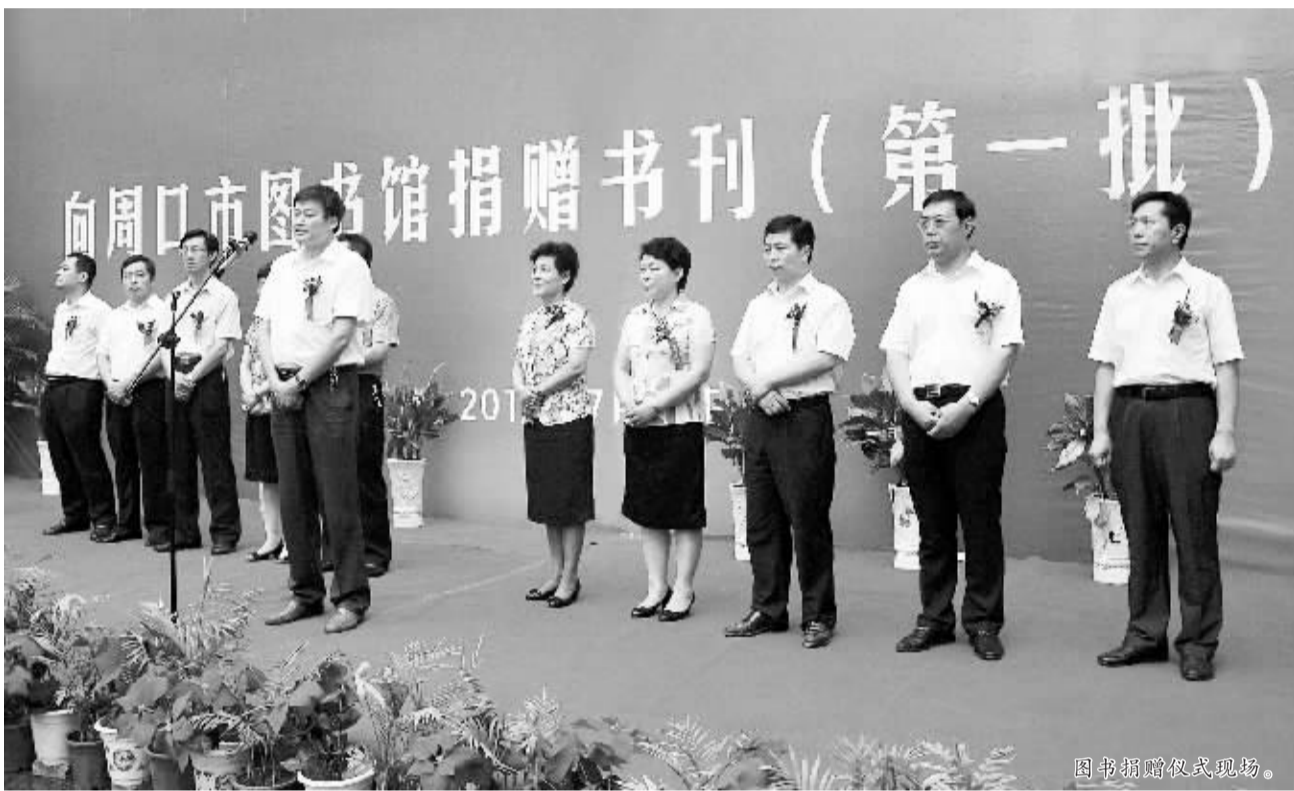
图书捐赠仪式现场。

“为市图书馆的建设贡献自己的一份力量,让书籍发挥更大的价值。”这是广大市民共同的心声。