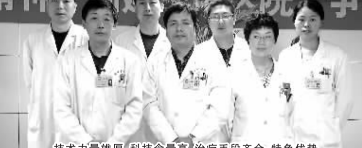
技术力量雄厚、科技含量高、治疗手段齐全、特色优势突出的周口市中医院肿瘤科医务团队

科室开放床位50多张,年均收治各种恶性肿瘤患者千余人次,长年有肿瘤专家坐诊,科室拥有医用直线加速器、高档模拟机、立体定向三维适形调强放疗系统(X-刀)、放射粒子植入系统、多极射频肿瘤消融仪、冷循环微波刀、深部热疗机、美国巴德切割式活检枪等一大批先进的肿瘤诊疗设备,在全市处于领先水平。