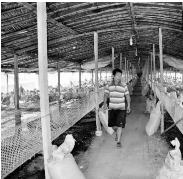
驻村工作开展以来,鹿邑县邱集乡前尹王行政村党支部积极引导村民,充分利用本村优势,大力发展以养猪、养鸡、养鸭为主的绿色养殖业,壮大农村经济。

深入宣传,全面动员,确保政策无盲区、责任无断层、工作无死角。一是营造浓厚舆论氛围,激发干部群众参与热情。