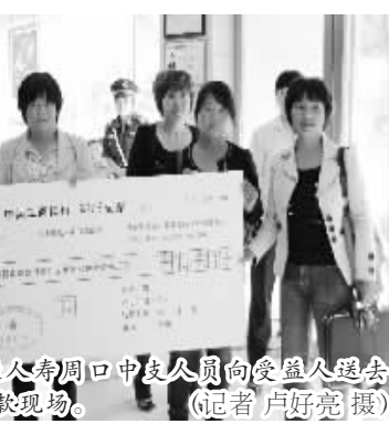
图为泰康人寿周口中支理赔人员向受益人送去118万元理赔款现场。

核,认为该案件符合意外身故4倍赔付标准,迅速给予了118万元的赔付。当天下午3点,手持“风险无情 泰康有爱”锦旗的谢女士走进工行郸城县支行。她拉着泰康人寿周口中支总经理的