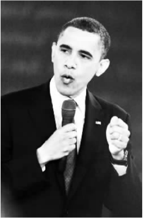
美国总统奥巴马在总统选举第二场辩论中发言。

一场辩论的好坏或许能影响到最终选举结果,但粉饰太平也好,夸大其词也罢,辩论归辩论,而经济现实依然严峻。对美国民众而言,下一个四年,他们希望看到经济重振旗鼓,唯有事实胜于雄辩。(据新华社美国亨普斯特德 10 月 16 日电)