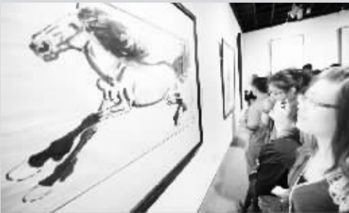
▲“百代风范——中国现代绘画艺术典藏大展”在杭州开幕 10 月 17 日,观众在欣赏徐悲鸿创作的国画《大红马图》。当日,“百代风范——中国现代绘画艺术典藏大展”在杭州浙江美术馆开幕。

◀河南秋粮总产有望再创历史新高 10 月 16 日,河南省焦作市温县黄庄镇卫村两名儿童在玉米挂下玩耍。据河南省农业厅信息,目前,河南省秋粮收获基本结束,从各地反馈情况来看,今年秋粮丰收已成定局,预计总产量有望再创历史新高。