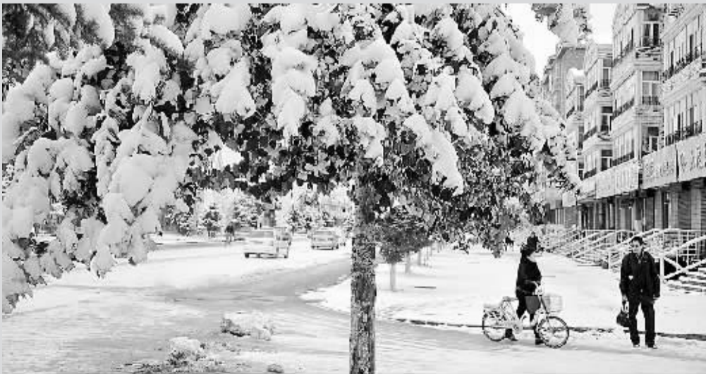
▲黑龙江内蒙古等地迎来降雪 10 月 17 日,人们行走在雪后的内蒙古呼伦贝尔牙克石市街头。据中央气象台消息,受较强冷空气影响,10 月 16 日夜间至 18 日,内蒙古东部、黑龙江中西部等地的部分地区有小到中雪(雨)或雨夹雪,内蒙古东北部、黑龙江西北部的局地有大雪。