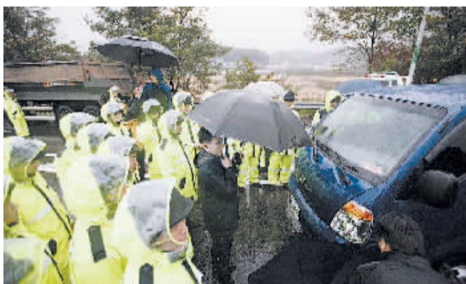
韩国团体计划向朝鲜散发传单活动遭韩国警察阻止被迫取消 10月22日,在临近韩国坡州市的临津阁区域,韩国反朝团体“朝鲜民主化推进联合会”的车辆前进,该团体计划向朝鲜散发20万张传单的行动被迫取消。

新华社金边10月22日电 柬埔寨首相洪森22日签署政府令,宣布明年10月15日为公共假日,以纪念西哈努克国王逝世。西哈努克国王于1972年10月15日在北京病逝,享年90岁,其灵柩已于17日运抵金边并依照王室传统习俗举行葬礼。柬埔寨政府规定17日至23日为全国哀悼日。