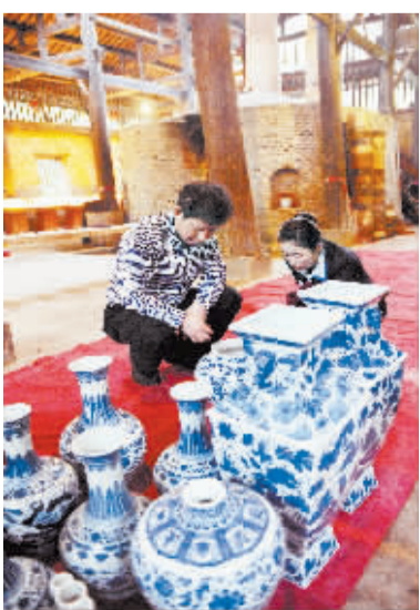
▲景德镇宋元明三代瓷窑复烧成功 10月22日,工作人员在观看元代馒头窑烧成的瓷器。当日,江西省景德镇民俗博物馆举行宋代龙窑开窑仪式暨宋元明三代瓷窑同时开窑。经过陶瓷专家、工艺美术大师等专业人士的鉴定,确认10月19日点火的宋代龙窑、元代馒头窑、明代葫芦窑同时复烧成功。这是景德镇千年历史中首次实现三代瓷窑同时“复活”点火并取得成功。