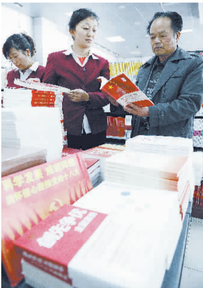
“喜迎十八大”图书展销受欢迎 10月22日,顾客在银川市新华书店挑选“喜迎十八大”系列图书。近日,宁夏银川市各新华书店纷纷设立“迎接十八大优秀出版物”图书音像专柜,集中展销中国共产党历史、发展等系列图书及音像制品,深受广大读者欢迎。