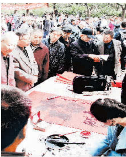
济南“九月九”重阳山会人气旺 在济南市千佛山“九月九”重阳山会上,老人们可以免费获赠“福”字(10月22日摄)。重阳节期间,一年一度的“九月九”重阳山会在济南市千佛山景区举行。本届山会从20日开始,为期8天,举办以来每天吸引3万多名游客前来参加。在山会上,游客可以品尝来自全国各地的美食,欣赏丰富多彩的曲艺表演,购买到特色山货、手工艺品等商品。 新华社发

据新华社东京10月22日电 日本冲绳县首府那霸市议会22日召开临时议会,就“美军强奸妇女致伤事件”分别通过对美国政府抗议决议和对日本政府意见书,要求美方严惩强奸案凶手。 这份致美国总统、国防部长及国务卿等人的抗议决议称,“10月16日,发生了隶属于美国得克萨斯州沃思堡海军航空基地的两名美军强奸冲绳妇女的恶劣事件……今年8月18日刚刚发生驻日美军当街猥亵妇女致伤案。接连发生的美军暴行,是对女性尊严和人权的蹂躏,对市民安定生活的威胁,(我们)对此无法容忍。” 抗议决议还说,“日美政府不顾冲绳民众的反对,强行将MV-22‘鱼鹰’倾转旋翼机部署到冲绳,冲绳百姓的愤怒本已到了极点,美军强奸事件的发生让冲绳百姓的愤怒到达了临界点。” 抗议决议要求美国政府严惩加害者并对受害者进行全额赔偿;制定有效政策防止此类事件再次发生;对优先保障美军及其相关人员利益的不平等的《日美地位协定》进行根本性修订;进一步缩小驻日美军基地规模等。 据悉,那霸市议会将于22日下午将抗议决议和意见书分别送交美日两国政府。