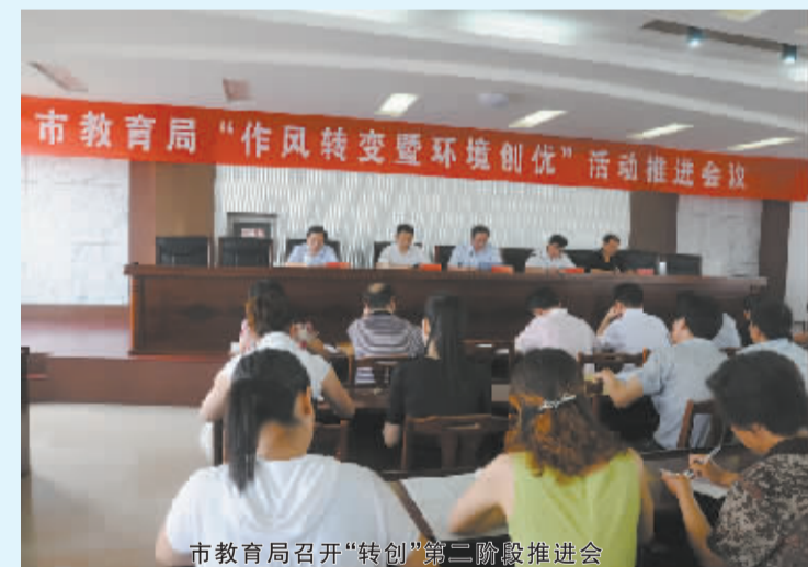
市教育局召开“转创”第二阶段推进会