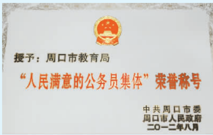
市教育局被市委、市政府授予“人民满意的公务员集体”荣誉称号