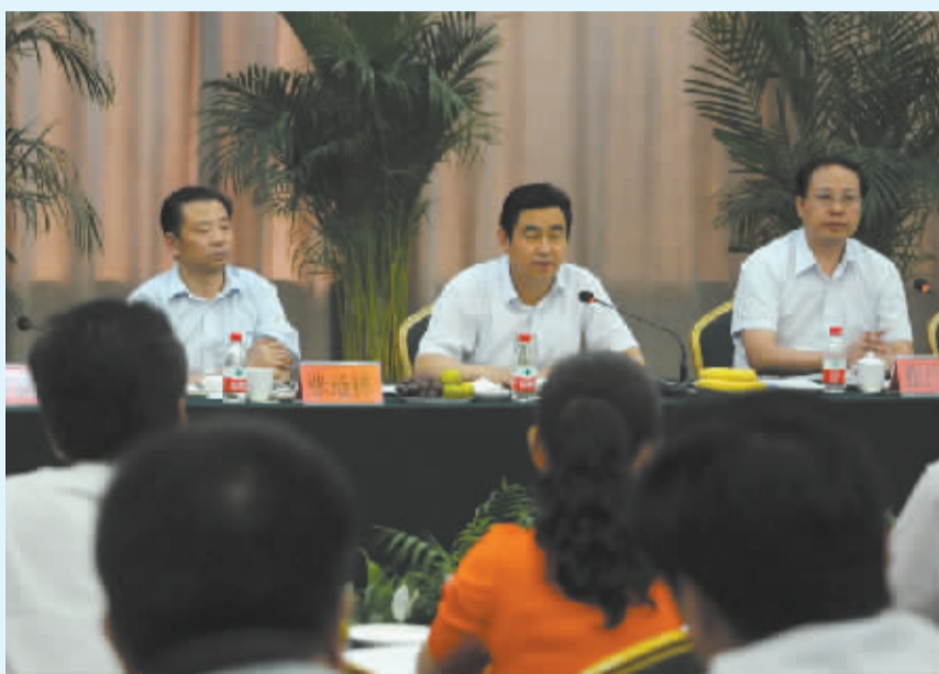
市长岳文海出席全市教师节座谈会