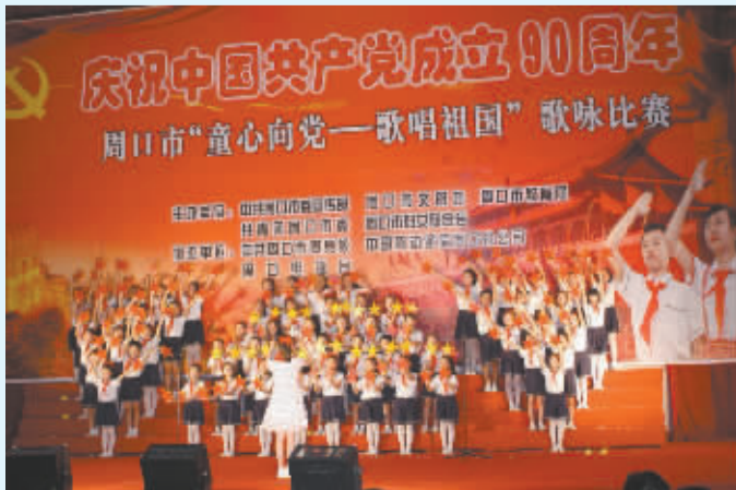
全市教育系统开展丰富多彩的文艺活动