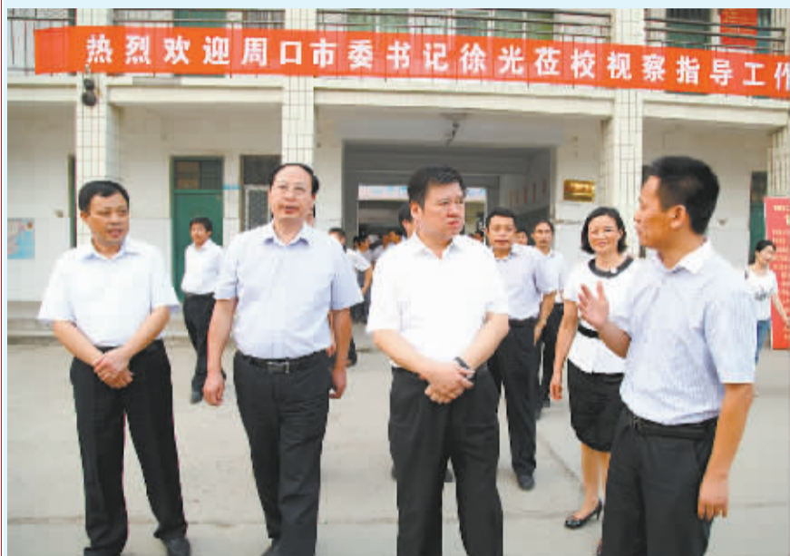
市委书记徐光赴郸城一高调研