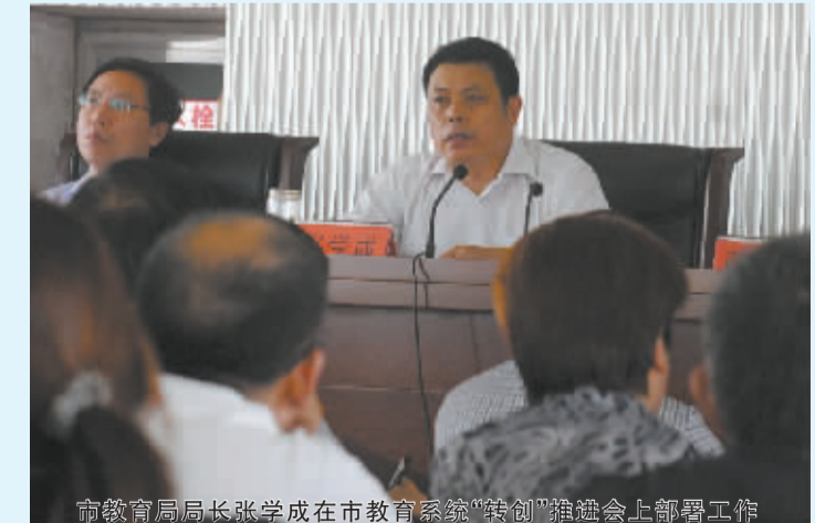
市教育局局长张学成在市教育系统“转创”推进会上部署工作