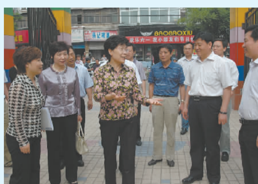
市委副书记吕彩霞六一儿童节看望慰问广大教职工