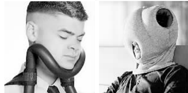
有贪睡支架坐着睡觉也不怕