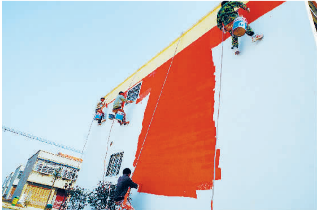
12 月 2 日, 在项城市范集镇新型农村社区, 工人正忙着粉刷墙壁。据悉, 该社区建成后, 可容纳村民 10703 人, 共节约土地 1300 余亩。目前, 该社区已建成 116 套新住宅, 部分农户入住新居。