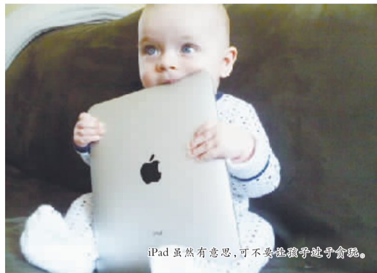
iPad虽然有意思,可不要让孩子沉迷于玩手机。