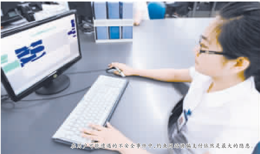
在用户可能遭遇的不安全事件中,钓鱼网站诱骗支付依然是最大的隐患。

日前,中国互联网络信息中心(CNNIC)发布《2012年中国网络支付安全状况报告》(以下简称《报告》)。报告显示,2012年国内网上支付整体安全使用状况较好,仅5.3%的网上支付用户认为网上支付不安全。