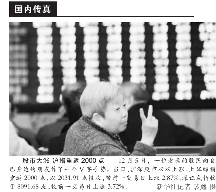
股市大涨 沪指重返 2000 点