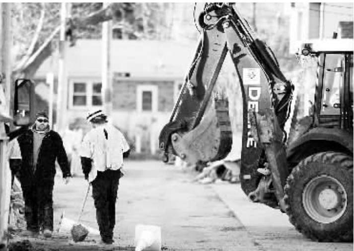
纽约飓风灾后重建进展缓慢 12月6日,美国纽约市电力施工人员在斯塔滕岛居民区进行电力恢复施工。纽约自10月底遭受飓风“桑迪”袭击后,由于救援资金缺口巨大,重建工作进展缓慢,许多受灾地区至今电力和暖气等仍未恢复,一些受灾人员只能暂居在临时安置场所。据纽约州州长科莫介绍,纽约州清理和恢复飓风灾害损失大约需要420亿美元。

厘米至1米之间。此后,气象厅在宫城县石卷市观测到了浪高1米的海啸,在岩手县大船渡、久慈港和福岛县相马市分别观测到了浪高20厘米、40厘米的海啸。