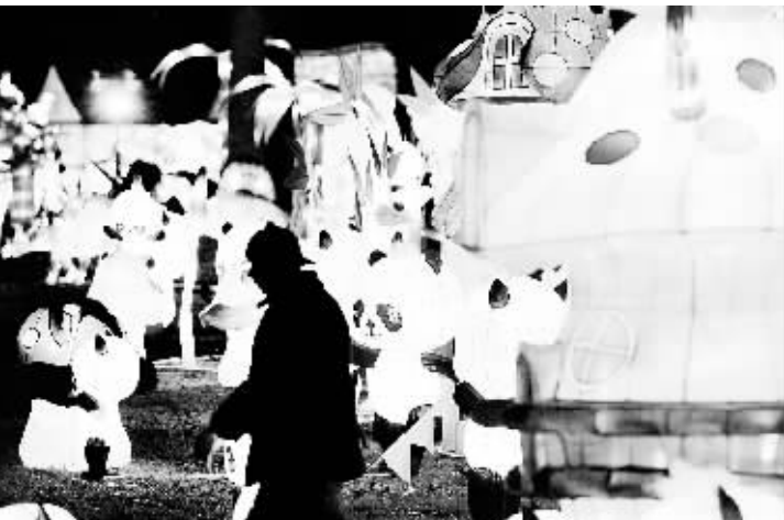
中国花灯点亮鹿特丹 12月6日,游客在荷兰鹿特丹欣赏中国花灯展。当天,中国花灯展在荷兰鹿特丹拉开帷幕。本次花灯展共包括35组造型各异、生动活泼的主题灯饰,是在欧洲举办的最大规模的中国花灯展之一。据悉,本次花灯展将一直持续到明年2月中旬。新华社发

赖德指出,中国经济规模日益扩大且表现良好,劳动者工资持续增长,平均工资自2000年至2010年增长了两倍多,这使得“中国因素”也极大拉动了全球劳动者工资增速。