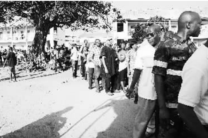
加纳举行全国大选 12月7日,选民在加纳首都阿克拉坎顿区警察局投票点外等待投票。加纳当日举行全国大选,选举新一任总统和275名议会议员。

穆尔西11月颁布新宪法声明,规定总统有权任命总检察长,强调在新宪法颁布及新议会选出前,总统发布的所有总统令、宪法声明、法令和政令均为最终决定,任何方面无权更改。穆尔西随后宣布将于12月15日就新宪法草案举行全民公投。近日,埃及各地爆发穆尔西支持者与反对者的冲突,造成人员伤亡。穆尔西6日晚发表讲话,邀请反对派别本月8日开展全国对话,并称新宪法草案公投将于15日如期举行。