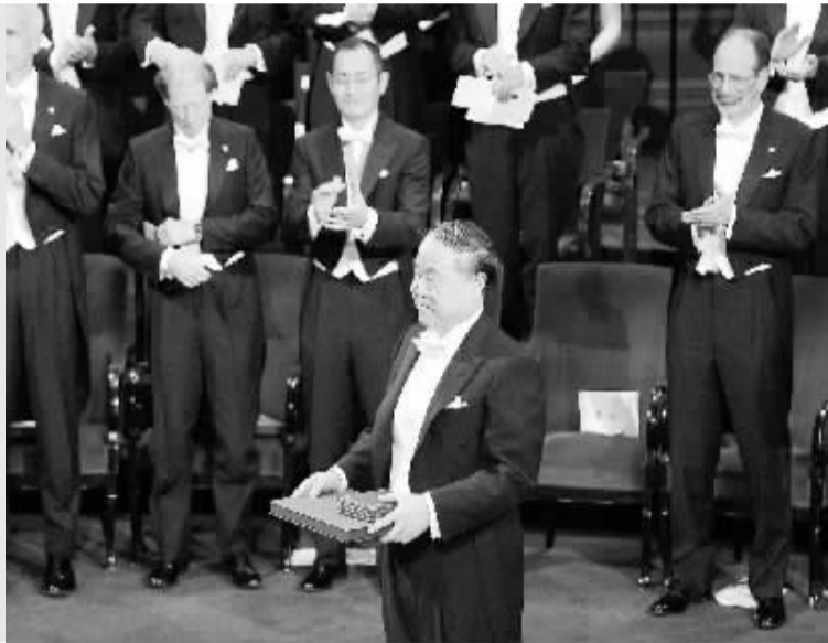
莫言领取诺贝尔奖 12月10日,在瑞典首都斯德哥尔摩音乐厅举行的2012年诺贝尔奖颁奖典礼上,中国作家莫言(前)领取诺贝尔文学奖。

12月10日是瑞典工业家诺贝尔的逝世纪念日,每年的诺贝尔奖颁奖典礼都安排在这一天举行。