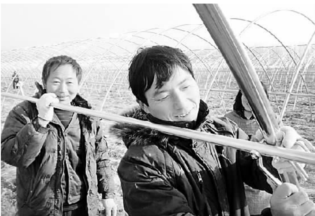
今年,美国安食联合农业发展有限公司投资1亿元在扶沟县色屯镇新建3000亩蔬菜出口基地,一期计划建设钢骨架棚800个、日光温室40个。图为正在搭建的钢骨架棚。

信用社对建棚户加大放贷力度。3年来,乡政府积极争取项目资金300万元,帮助建棚户协调小额贷款200万元。乡主要领导千方百计克服资金困难为建棚户提供路、水、电等便利条件。该乡积极争取项目资金,完善园区路、水、电、井、渠等基础设施建设,新修园区水泥道路2000米,架打机井100眼,新装变压器3台,架设低压线路2000米,开挖沟渠4000米。同时,该乡加强对本地销售市场的统一管理,改善市场基础设施条件,建立2个大型蔬菜批发市场和6个中小型销售市场,果断取缔马路市场1个。