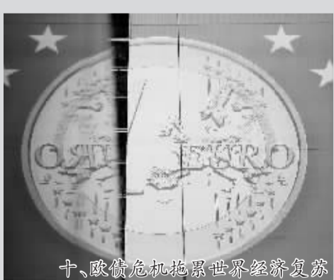
十、欧债危机拖累世界经济复苏