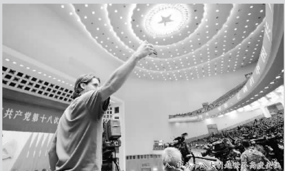
八、中共十八大引起世界高度关注