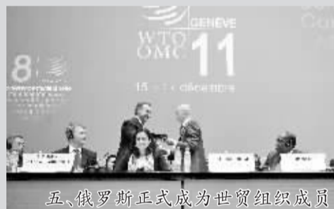
五、俄罗斯正式成为世贸组织成员