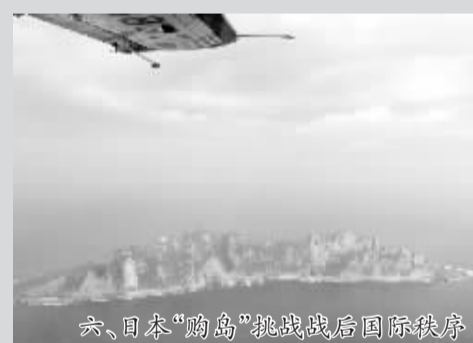
六、日本“购岛”挑战战后国际秩序