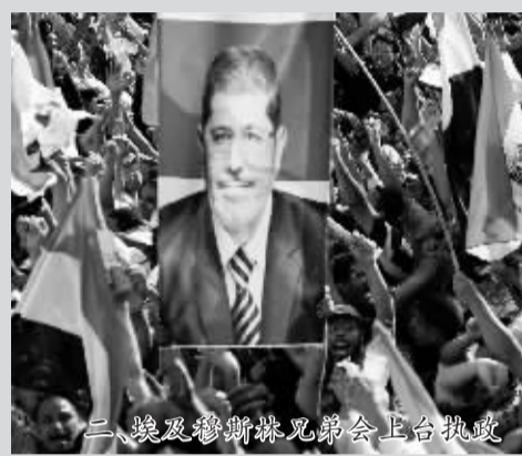
二、埃及穆斯林兄弟会上台执政