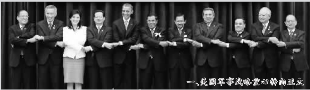
一、美国军事战略重心转向亚太