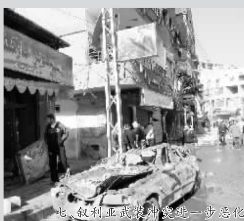
七、叙利亚武装冲突进一步恶化