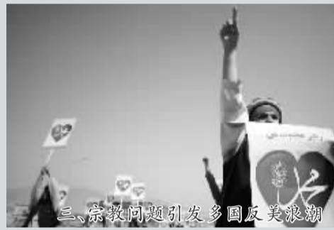
三、宗教问题引发多国反美浪潮