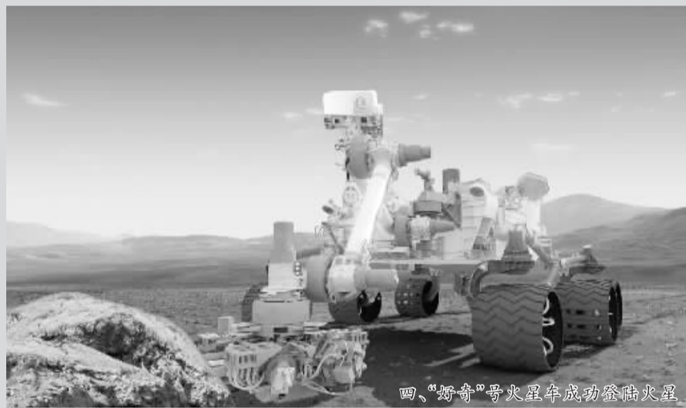
四、“好奇”号火星车成功登陆火星