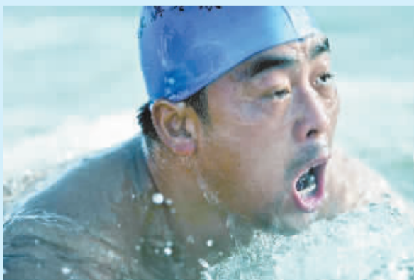
1 月 4 日, 内蒙古巴彦淖尔市五原县的一位农民在采摘番茄。近日, 尽管户外严寒地冻, 内蒙古巴彦淖尔市的温室大棚内的果蔬陆续收获。据悉, 巴彦淖尔市可利用冬季温室种植面积约 6.8 万亩, 平均亩产 4000 公斤左右。