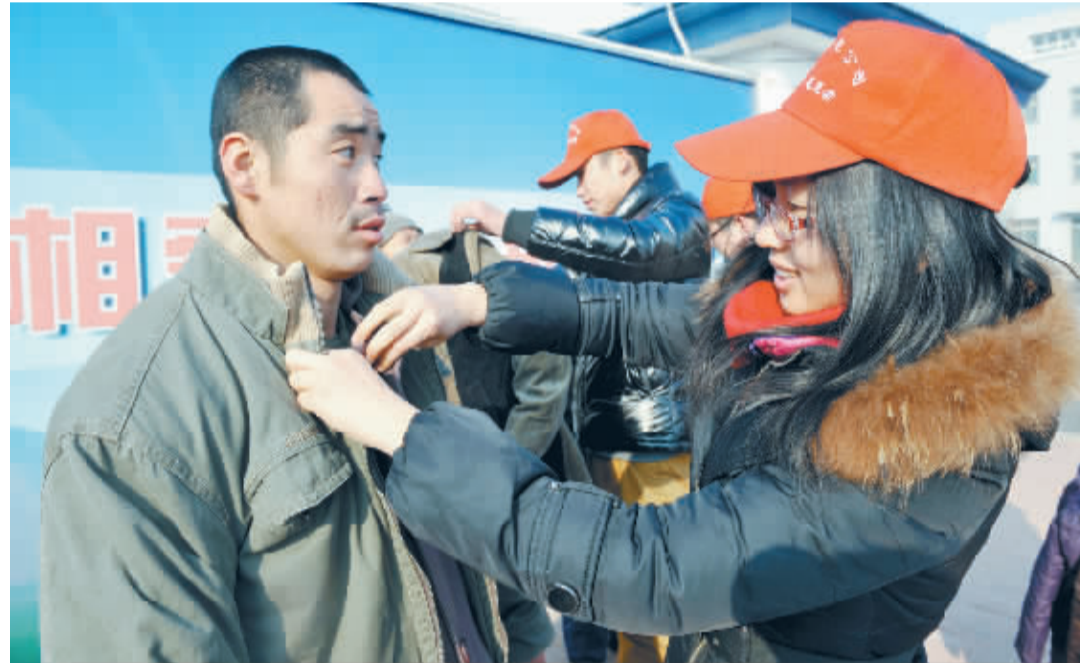
1 月 4 日, 国家电网山东淄博供电公司志愿者为淄博市救助管理站流浪人员送去过冬的棉衣。当日, 淄博供电公司启动以“日行一善 快乐一天”为主题的志愿活动, 400 多名志愿者走进救助站、敬老院、学校进行寒冬送暖、冬季安全用电知识进校园等系列活动。