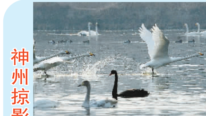
1 月 5 日, 一名选手在水中畅游。当日, 哈尔滨国际冬泳邀请赛暨第 29 届江上冰雪乐园开幕式在松花江上举行, 来自国内外的 500 余名冬泳爱好者共同挑战严寒, 用这种“冰”气十足的方式庆祝新年到来。