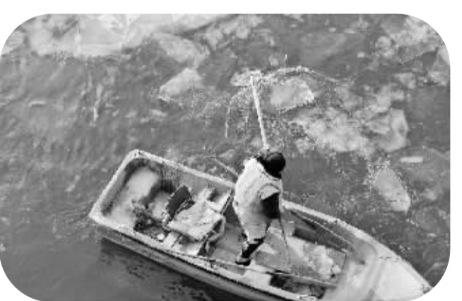
“小寒”节气寒意浓 1月5日,太原市汾河景区工作人员在汾河上破冰。当日是农历“小寒”节气,受冷空气影响,太原市最低气温降至零下16摄氏度,市民出行时“全副武装”抵御严寒。

根据最新的气象预报,6日至7日,江汉、江淮、贵州北部等地有小到中雪或雨夹雪。8日至11日,西北地区东南部、江淮、江南北部将出现小到中雪(雨),局地有大雪;江南中南部将会出现雨转雨夹雪天气,部分地区将有冻雨;华南东部和南部等地部分地区有中到大雨。