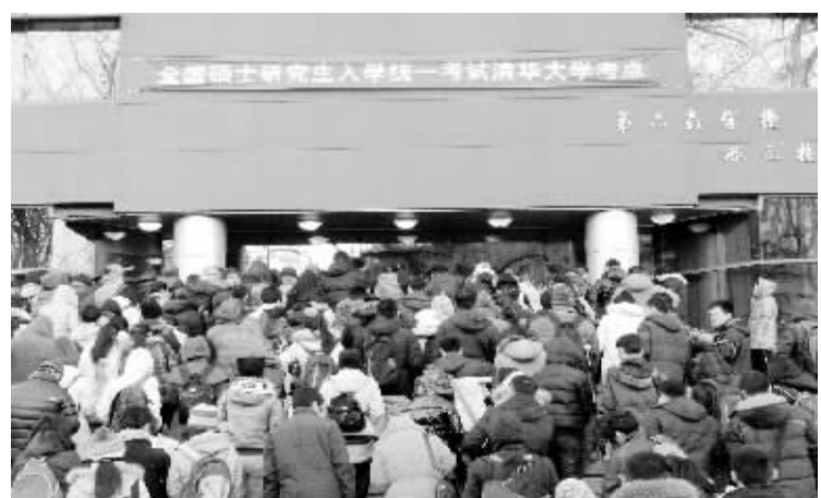
2013年全国硕士研究生招生考试拉开帷幕 1月5日,考生在北京清华大学考点排队进入考场。当日,2013年全国硕士研究生招生考试拉开帷幕。据统计,今年全国共有约180万人参加考试,创历史新高。

新华社北京1月5日电 中国空军有关部门1月5日表示,空军常年保持高度戒备,严密监视空中动态。缅甸北部发生武装冲突以来,空军重点加强了中缅边境地区空情监控,共掌握缅甸飞机118架次119架次,最近距中缅边境约5公里,没有发生缅甸战机进入中国领空的情况。