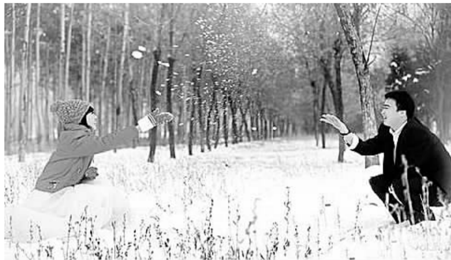
图为假日里情侣在东北玩雪。

每次节后的长时间连续工作,真让人头疼。有点儿担心自己会患上“节后忧虑症”和“工作恐惧症”。对此,有律师认为连续7天上班,显然是置用人单位于涉嫌违反《劳动法》的境地,劳动者则因此被剥夺每周至少休息1日的法定休息权利。