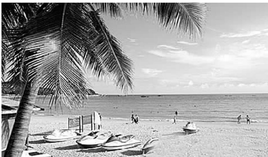
图为假日里人们在海南享受海天景色、椰林风情。