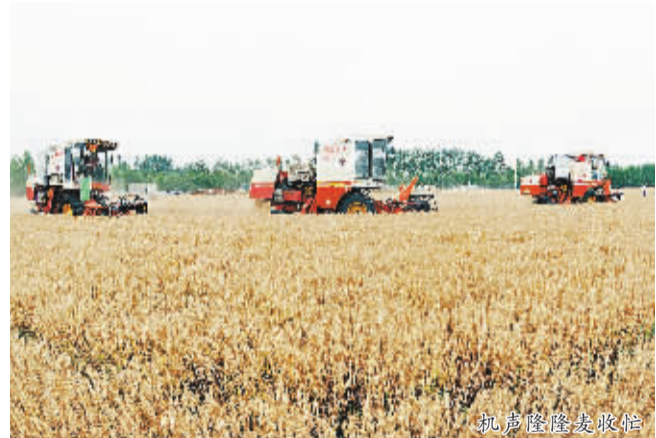
30万千瓦燃煤发电机组

◆亮点二:粮食生产再创新高,全市粮食总产首次突破150亿斤大关,达到154.6亿斤,连续九年丰产增收,我市被表彰为全国粮食生产先进市,8个县市区被表彰为全国粮食生产先进县市区。