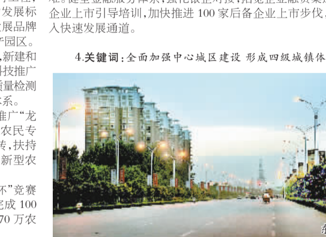
4关键招:全面加强中心城区建设 形成四级城镇体系

◆深化企业服务。继续开展企业服务年活动,帮助企业解决困难,健全金融服务体系,强化银企对接,拓宽企业融资渠道,持续实施企业上市引导培训,加快推进100家后备企业上市步伐,促进企业进入快速发展通道。