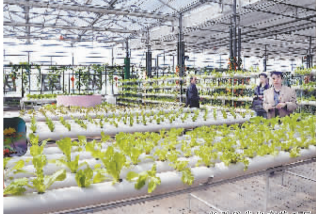
现代农业观光工厂

◆亮点六:改革创新深入推进。行政审批制度改革逐步深化,事业单位改革有序开展;医药卫生体制改革取得新成效;文化广电新闻出版局组建工作迈出步伐。非公有制经济快速发展,预计全年完成投资746.4亿元,占全部投资的87.7%,成为拉动全市固定资产投资增长的主要力量。土地开发利用管理“三项机制”不断完善,建设用地需求得到较好保障。