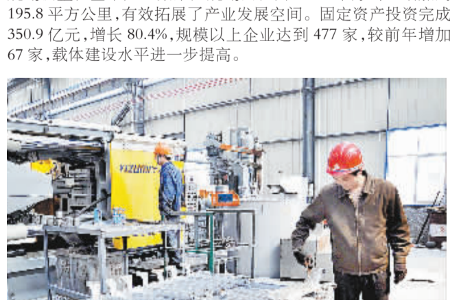
高压铸铝散热器生产线

◆亮点三:工业发展提速增效,预计全市规模以上工业主营业务收入增长25%,用电量增长19.2%,两项指标增速均居全省第1位;规模以上工业利润增长20%,增速居全省第3位。抢抓省政府对产业集聚区规划调整机遇,对8个产业集聚区进行了规划调整,全市产业集聚区规划面积由139.8平方公里增加到195.8平方公里,有效拓展了产业发展空间。固定资产投资完成350.9亿元,增长80.4%,规模以上企业达到477家,较前年增加67家,载体建设水平进一步提高。