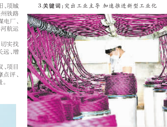
3关键招:突出工业主导 加速推进新型工业化

◆抓好农村生产生活条件改善。扎实开展扶贫开发“小康村”竞赛活动,提升扶贫开发水平,解决18.5万农村人口脱贫问题,完成100个整村推进扶贫项目。继续实施农村饮水安全工程,再解决70万农村饮水不安全问题。改造县乡公路120公里。