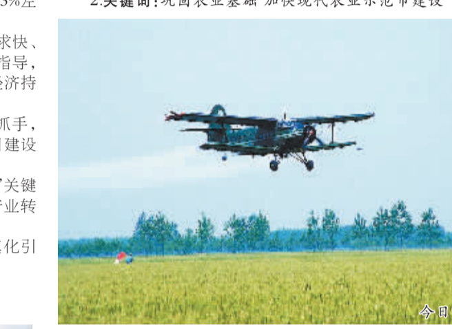
2关键招:巩固农业基础 加快现代农业示范市建设

◆强化项目建设推进机制。进一步健全完善项目联席会议、项目建设进度通报等制度,继续采取领导分包、现场办公、观摩点评、督查督导等办法,大力优化项目建设环境,提升项目实施质量。