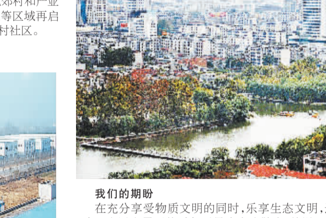
6关键招:加快发展方式转变 建设生态宜居周口

◆我们的期盼:沈丘县下路口乡的冯某前段时间来周口看病,无论是医院门诊还是住院部都挤不进去,像她这样乘坐一两小时车来周口大医院看病的人,目前在市仍有不少。她由衷期盼老家人能早日实现“小病不出村,大病不出县!”