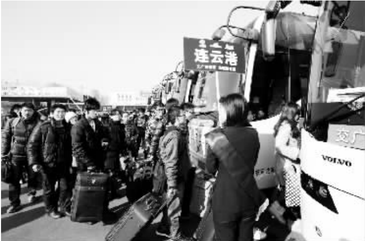
南京开出“爱心包车”免费服务困难学生 1 月 18 日,在南京中央门汽车站,乘坐“爱心包车”的学生排队上车。当日,由江苏交通广播网等爱心单位组织的免费“爱心包车”在南京中央门长途汽车站启动。乘坐这次包车的多是在南京各大高校上学的家庭经济困难的学生,4 辆包车分别由南京开往盐城、连云港、宿迁、南通。

“春风行动”期间,全国各级公共就业人才服务机构将完善工作措施,加大宣传力度,强化对接服务,优化就业环境,切实帮助农村劳动者免费得到“春风卡”等宣传资料,获得政策指导、岗位信息、维权支持和法律援助等公共就业和人才服务,并根据自身需求分别享受职业培训和创业服务。