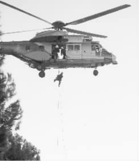
洛杉矶郡举行校园反恐演练 1 月 17 日,在美国洛杉矶郡克莱蒙特大学园区,两名特警从直升飞机上索降。从 1 月 16 日起,洛杉矶郡消防局和警察局连续三天举行校园反恐演练,约 400 名消防员和警察以及近 5000 名学校师生参加演练。