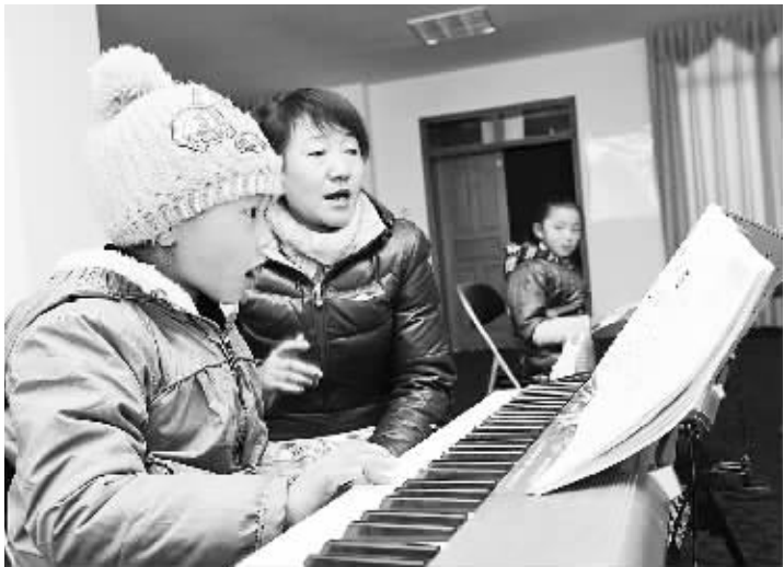
免费兴趣班伴高原小朋友度寒假 1 月 18 日,小朋友在西藏自治区群众艺术馆学习演奏电子琴。从拉萨市中小学校放寒假开始,西藏自治区群众艺术馆就推出了假期免费的兴趣培训班,开设的课程有电子琴、钢琴、二胡、笛子、六弦琴、扬琴、舞蹈和美术,免费兴趣班的开设丰富了小朋友们的假期生活。

中国计量科学院首席科学家李天初院士表示,这是近 20 年来中国第一次在国际上对修改光学标准频率作出贡献。