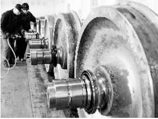
呼和浩特铁路局全面开展春运保障工作 1 月 17 日,呼和浩特铁路包头车辆段的工作人员在进行轮对组装。

新华社北京 1 月 17 日电(记者 林红梅)今年春运期间,我国公路客运量预测将达到 31 亿人次,同比增长 9%;水路客流量预计达 4308 万人次,同比增长 1.5%。