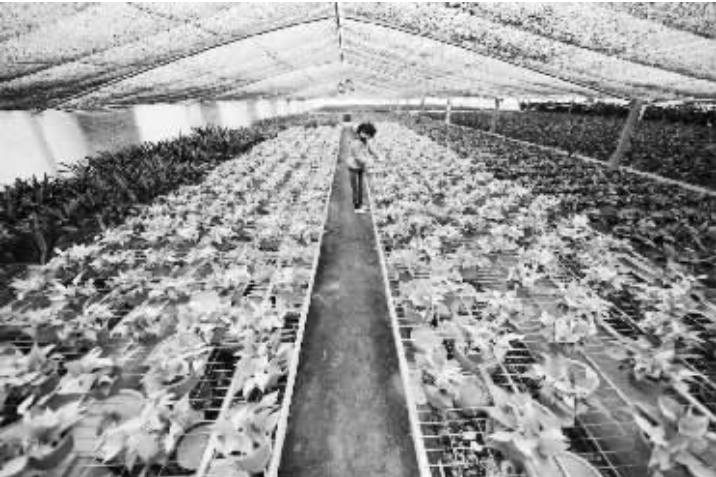
2012 年中国经济增长 7.8% 工作人员在江西省新余市的一处花卉苗木基地打理绿色植物(2012 年 11 月 21 日摄)。1 月 18 日,国家统计局发布初步核算数据,全年国内生产总值为 519322 亿元,按可比价格计算比上年增长 7.8%,高出年初预期目标 0.3 个百分点。

得国家技术发明奖通用项目 45 项(一等奖 2 项,二等奖 43 项),占总数(一等奖 2 项,二等奖 61 项)的 71.4%;获得国家科学技术进步奖通用项目 114 项(特等奖 2 项,一等奖 7 项,创新团队奖 2 项,二等奖 103 项),占通用项目总数 162 项(特等奖 2 项,一等奖 13 项,创新团队奖 3 项,二等奖 144 项)的 70.4%。