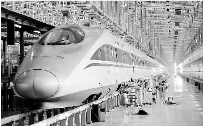
动车“体检”备战春运 1 月 18 日,在西安北动车所,工作人员对一列动车组进行全面检修。