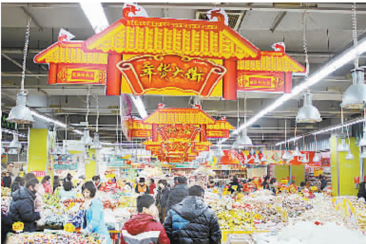
1月27日,项城市一家商场各种商品琳琅满目,市民正在购物。春节临近,百姓消费购物的热情持续高涨。