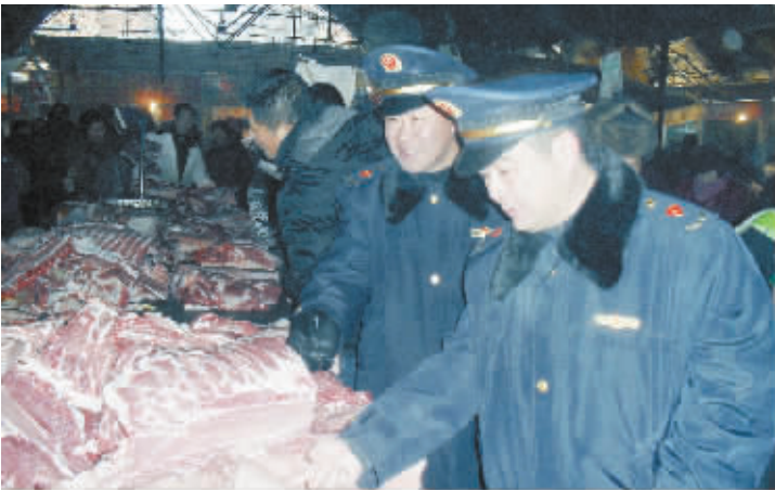
近日,周口市工商局川汇分局精心组织,周密部署,认真开展春节期间鲜肉市场集中整治行动,确保群众消费安全。图为工商执法人员在农贸市场检查鲜肉质量。