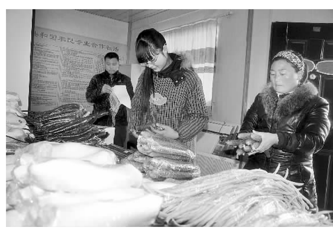
作为周口市“菜篮子”工程,太康县白云蔬菜合作社建成了占地1000亩、以蔬菜种植为主的现代农业示范园区。随着春节的临近,社员们适时采收新鲜蔬菜,以确保春节期间蔬菜供应。图为白云蔬菜合作社社员们正将新鲜的蔬菜装箱。(记者刘俊涛通讯员高一麟摄)

创新治安防范模式,切实增强防控效果。该乡在人防上动真格。各个行政村按照乡党委、乡政府的统一部署,都成立了义务巡逻队,乡班子成员坚持每晚带值班干部、联防队员和派出所干警下村巡逻,设置卡点,督查各村治安巡逻情况。在物防上又有新加强。2012年以来,王店乡进一步完善了亮化工程建设,全乡路灯总量达到了4800盏,31个