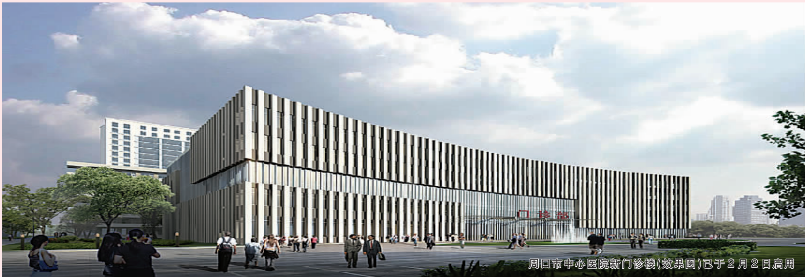
周口市中心医院新门诊楼(效果图)已于2月2日启用