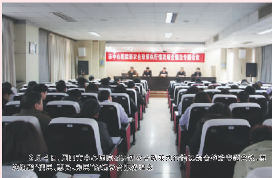
2月4日,周口市中心医院召开新农合政策执行情况综合整治专题会议,再次明确“便民、惠民、为民”的新农合服务理念

有人赞美她是生命的保障,是爱心的凝聚; 有人赞美她是农民健康的“保护伞”,是支撑农民健康的“参天大树”;