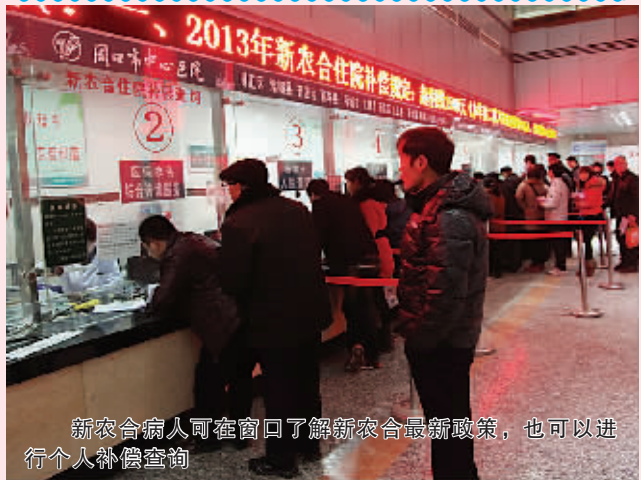
新农合病人可在窗口了解新农合最新政策,也可以进行个人补偿查询