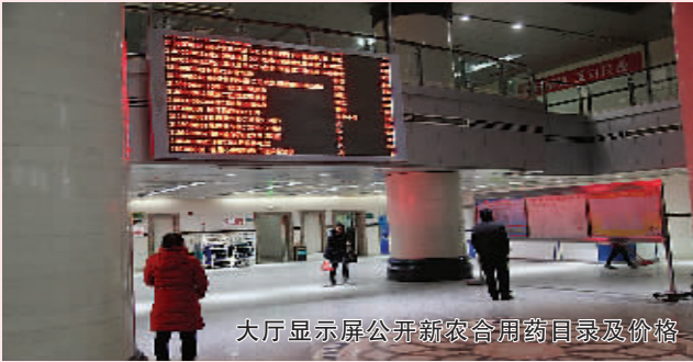
大厅显示屏公开新农合用药目录及价格

这是心的呼唤,这是爱的奉献。周口市中心医院在认真落实新农合政策过程中,通过一系列行之有效的措施,满足了农民的就医需要,使农民改变了过去“小病拖,大病挨,重病才往医院抬”的错误认识。我们相信,通过他们的努力,便民新农合的道路会越走越宽广,惠民之歌会越唱越响亮。