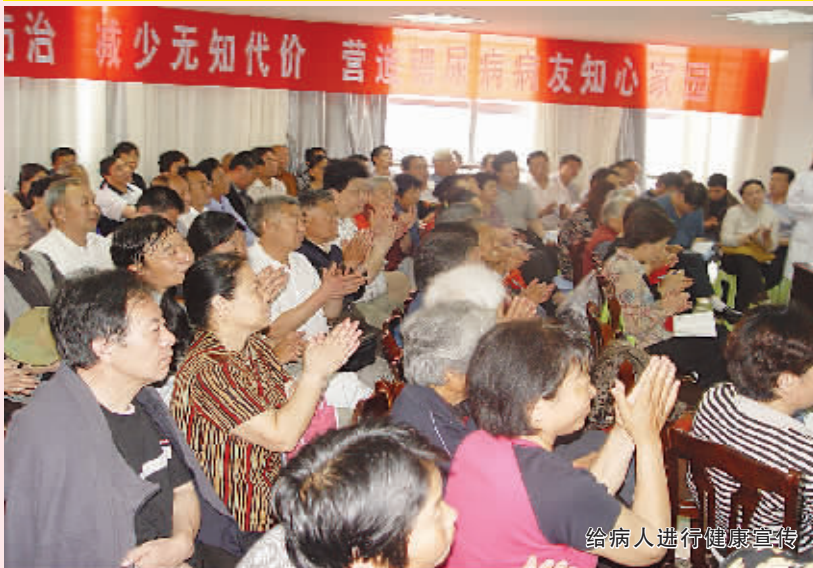
给病人进行健康宣传