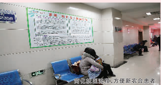
简化就医流程,方便新农合患者