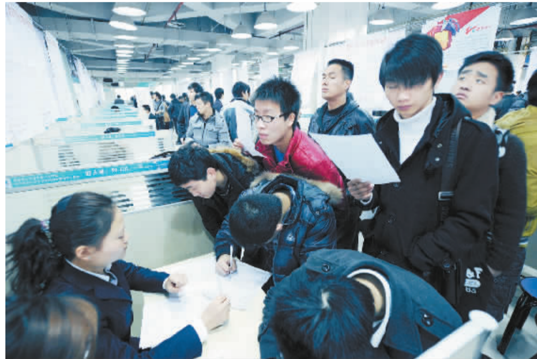
2月16日,求职者在重庆江北一场大型招聘会上现场应聘。当日是大年初七,也春节长假后上班第一天,重庆各大人才市场陆续开门举办综合类或专场类招聘会。

水果;严格执行会议伙食标准,坚持集体吃自助餐;坚持统一乘坐大巴制度,尽可能不封路,合理控制交通管制的时间和规模;不组织代表参加与大会无关的活动;不组织宴请活动,不举办大型联谊活动,不搞专场演出;禁止产品供应商以大会名义进行广告性宣传;严格控制会议工作人员数量,最大限度地减少会议支出等。切实将会议开成团结、鼓励、节俭、务实的大会。