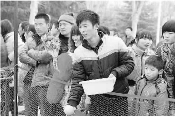
上图:春节期间,项城市处处张灯结彩,游人如织,节日气氛浓厚,套圈、划船等休闲方式令游人流连忘返,到处呈现出一派欢乐和谐的景象。(赵献伟 摄) 下图:2月14日,是正月初五,同时又是情人节,项城市到处充满欢乐和谐的气氛。图为项城市一对情侣正在公园玩套圈游戏。(赵献伟 摄)