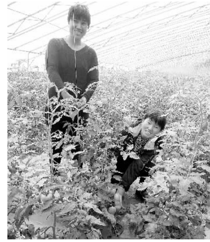
昨日, 川汇区一对姐妹正在大棚内管理西红柿。近年来, 我市各级政府积极引导农民调整农业种植结构, 通过发展日光温室大棚蔬菜等高效农业, 让农民走上了一条致富路。

项城要求追求实效。该市坚持着眼基层、立足实际, 结合机关、企业、学校、人口计生、新农村建设等各项工作, 深入开展“学雷锋、树新风”活动, 倡导人们从身边的小事做起, 从身边的人帮起, 开展互帮互助、互敬互爱的中华美德。南顿镇30多名党员干部组成“学雷锋”党员小组, 在帮扶农户过程中, 弘