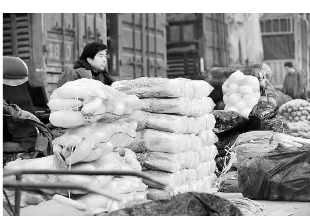
3月25日, 在太原市河西农副产品批发市场, 一位菜商在等待顾客。近日, 随着天气回暖, 山西省太原市蔬菜市场货源充足, 蔬菜平均价格呈现回落态势, 其中生菜、菠菜、西红柿等主要蔬菜较3月初下降超过20%。据蔬菜批发商介绍, 随着天气转暖, 利于蔬菜生长、采摘, 蔬菜价格还将稳中有降。

扬雷锋精神, 传递党的温暖, 推动中心工作, 促进社会和谐。广动员全民参与。组织“学雷锋树新风”志愿服务月活动, 营造出群众齐参与的良好社会氛围。为了进一步学习和弘扬雷锋精神, 项城职业中专注重学生的文明礼仪教育和艰苦奋斗精神的培养, 在校园中形成“学雷锋事迹、做雷锋传人, 树雷锋信念, 走雷锋