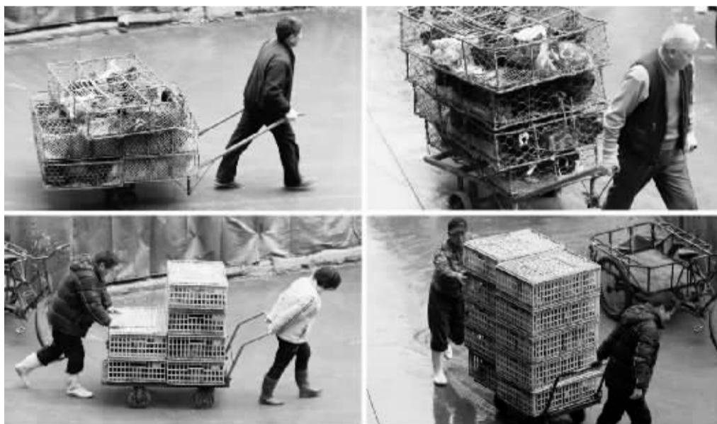
上海6日起暂停活禽交易 关闭所有活禽交易市场 4月5日,上海市最大的活禽批发市场——三官堂活禽市场的工作人员将市场内的活禽装箱运出。记者从5日召开的上海市政府新闻发布会上获悉,上海决定从4月6日起,在全市范围内暂停活禽交易,关闭所有活禽交易市场。

国家食品药品监管总局有关负责人介绍,帕拉米韦氯化钠注射液是我国首个静脉给药的神经氨酸酶抑制剂,抗病毒机理与奥司他韦相同,适用于治疗甲型流行性感冒。帕拉米韦开展的临床试验以奥司他韦为对照药,试验结果显示其疗效和不良反应与奥司他韦均无显著性差异。