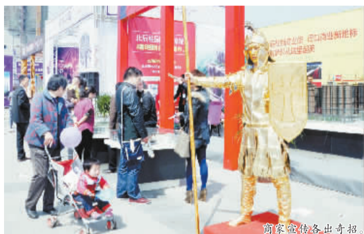
商家宣传各出奇招。