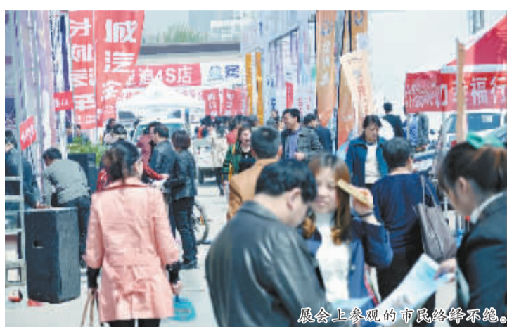
展会上参观的市民络绎不绝。