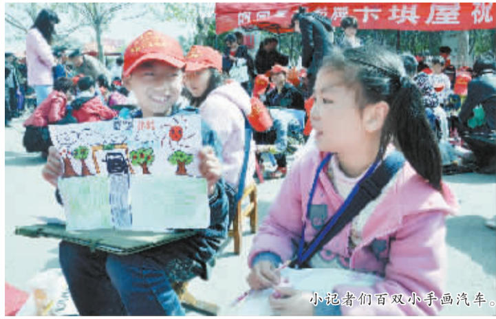
小记者们百双小手画汽车。