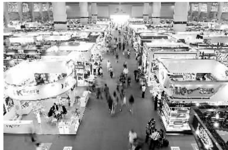
第113届广交会开幕 图为4月15日拍摄的广交会展馆内景。本届广交会展览面积116万平方米,展位总数59531个。

健全问责机制,责任要明确,责任要落实,问责要坚决。教育部将对落实不力、问题集中的地方进行问责,各地也要逐级问责。