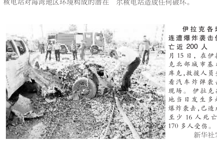
伊拉克各地连遭爆炸袭击 4月15日,在伊拉克北部城市基尔库克,救援人员查看汽车炸弹袭击现场。

周边国家沙特、巴林、科威特和阿曼等国均有明显震感,从而引发了海湾国家对伊朗核电站安全的担忧。