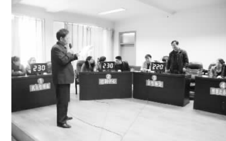
淮阳县流动人口知识竞赛活动现场。4月24日至25日,淮阳县为学习宣传省政府颁布的《河南省流动人口计划生育工作规定》,在县人口计生委举行了全县18个乡镇代表队和人口计生委机关18个股、室、站代表队参加的流动人口知识竞赛活动。

理,近期内不购买和食用相关禽类食品,确保院民生活不出问题;建立24小时疫情值班电话制度,明确责任人,时刻关注五保老人身体状况,做到早发现、早报告、早采取有效措施,确保五保老人安全。