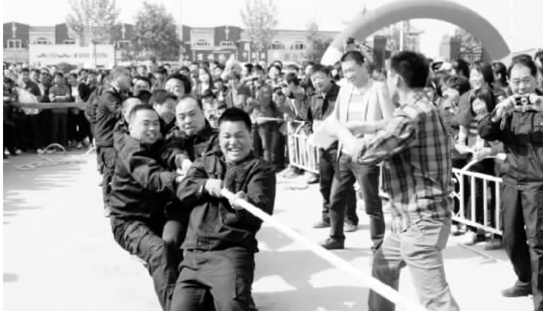
4月27日,淮阳县庆“五一”职工、农民工运动会在县总工会拉开帷幕。本次运动会是由县总工会主办的一次体育盛会,旨在满足广大干部、职工群众日益增长的体育文化需要,引导人们参与文明健康的体育活动,共有33家单位500余人参加。比赛项目包括拔河、篮球、乒乓球三大项目。

开生活会,大力开展批评和自我批评,并把组织生活会与转创工作有机结合,实现组织生活的常态化;二是开展党的知识竞赛,在潜移默化中让窗口工作人员全面掌握党的知识和各项方针政策;三是开展“党在我心中”主题征文和演讲比赛,增强党的向心力,使整个行政服务队伍更加热爱党、热爱党组织;四是长期开展创先争优,号召每名工作人员在服务上做标兵、工作上做先进,在窗口工作人员中初步形成了你追我赶、拼抢争先的工作氛围,并对评出的优质服务标兵、红旗窗口进行大张旗鼓的表彰。 党建工作的大力开展有力地促进了服务工作,截至4月底,县行政服务中心已办件12767件,收费1510.52万元,好人好事层出不穷,收到锦旗5面,表扬信38封。