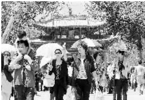
▲敦煌莫高窟游客承载力公布单日最高6000人次 5 月 17 日,游客在敦煌莫高窟大牌坊前行走。当日,敦煌研究院首次公布了与美国盖蒂保护研究所、澳大利亚遗产委员会开展的游客承载力研究成果:莫高窟游客中心建成后,单日最大游客接待 6000 人次。在报经相关部门批准后,2014 年 5 月 1 日起,莫高窟景区将按最高承载力合理接待游客,所有参观者必须通过网络、电话等形式预约后方可参观。

援地高校毕业生纳入本地就业扶持政策范围;承担对口支援任务的中央企业结合援助项目建设,积极吸纳当地高校毕业生就业。 落实现有政策,加强、改进服务 针对高校和地方反映毕业生在毕业年度因忙于求职有较大时间参加创业培训、享受补贴政策的情况,《通知》对高校毕业生参加创业培训的补贴期限进行了调整,将在高校毕业生享受创业培训补贴的开始时间从目前的毕业当年1月1日提前到毕业前一年7月1日。这一调整将方便更多的高校毕业生参加创业培训,提升创业能力。 为加强和改进对高校毕业生的就业服务,《通知》提出了两项新的政策:一是针对高校毕业生在全国范围内流动求职和就业的实际情况,允许高校毕业生在求职地(直辖市除外)进行求职登记和失业登记,并享受当地公共就业服务和就业扶持政策。二是允许将高校开展的校园招聘活动纳入公共就业服务大型专项活动项目给予适当支持。(据新华社北京5月17日电)