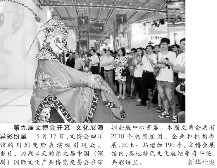
第九届文博会开幕 文化展演异彩纷呈 5 月 17 日,文博会四川展,比上一届增加 190 个。文博会展当日,为期 4 天的第九届中国(深圳)国际文化产业博览交易会在深圳会展中心开幕。本届文博会共有 2118 个政府组团、企业和机构参展,比上一届增加 190 个。文博会展馆内,各地特色文化展演争奇斗艳、异彩纷呈。

据新华社华盛顿 5 月 16 日电 美国国务院发言人珍·普萨基 16 日强烈谴责日本大阪市长桥下彻有关“慰安妇”的言论,敦促日本继续与邻国协同解决历史遗留问题。 普萨基在例行新闻发布会上说,桥下彻的言论“肆无忌惮且令人愤怒”,美方此前已经声明,日本当时强迫妇女充当性奴隶的行径“令人发指”,明显属于“极大规模”严重侵犯人权的行径。 普萨基表示,美方再次向受害者表达“真诚和深切的同情”,希望日本继续与邻国协同解决“慰安妇”和其他历史遗留问题,与邻国培育一种能够推动各国“向前发展的关系”。 桥下彻 13 日宣称,“慰安妇”制度是当时保持军纪的必需,没有证据显示日本政府或军方直接采取了绑架、胁迫“慰安妇”的行为。此言在中国、韩国和菲律宾等曾遭日本侵略的国家引发强烈的抨击。日本国内也批评桥下彻发表错误言论。