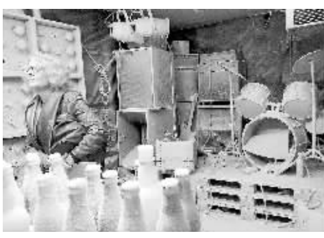
▲被冰冻住了的“演唱会” 5 月 16 日,在瑞士日内瓦拉特博物馆,观众在一名为“冰冻”的艺术品内参观。当日,日内瓦拉特博物馆当代艺术展开幕,30 余位世界艺术家的作品参展,作品分为雕塑、照片、视频和装置等类别。其中,艺术家克里斯托弗·比歇勒推出了一个名为“冰冻”的艺术品。他在一个巨大的冷藏室内搭设了一个小型舞台,邀请乐队在其中演出。在演出结束人们离去后,他开启冷气,调至零下 24 摄氏度,凝固住了留下来的一切物品。 本栏文图均为新华社发