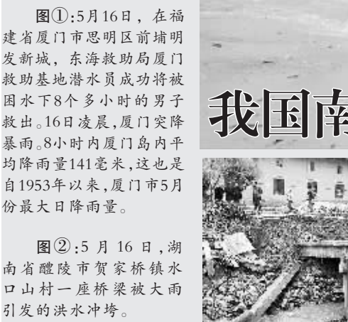
图②:5月16日,湖南省醴陵市贺家桥镇水口山村一座桥梁被大雨引发的洪水冲垮。