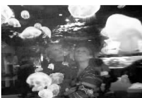
▲水母“来袭” 5 月 16 日,一名女子带着孩子在加拿大温哥华水族馆内观赏水母。当天,温哥华水族馆举办水母生态展,展出了来自世界各地超过 15 个不同品种的逾千只水母,让民众有机会近距离观赏这一独特的海洋生物。