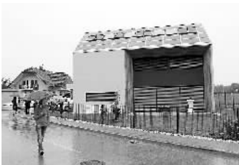
▲新式节能环保建筑——主动式太阳能房屋 5 月 16 日,一座采用主动式太阳能技术的环保建筑在斯洛文尼亚首都卢布尔雅那附近落成。这所占地 149 平方米的房屋由斯洛文尼亚一家绿色环保节能建筑企业建造,通过充分利用太阳能,达到室内通风换气、采暖、降温 and 去湿等多种功能。