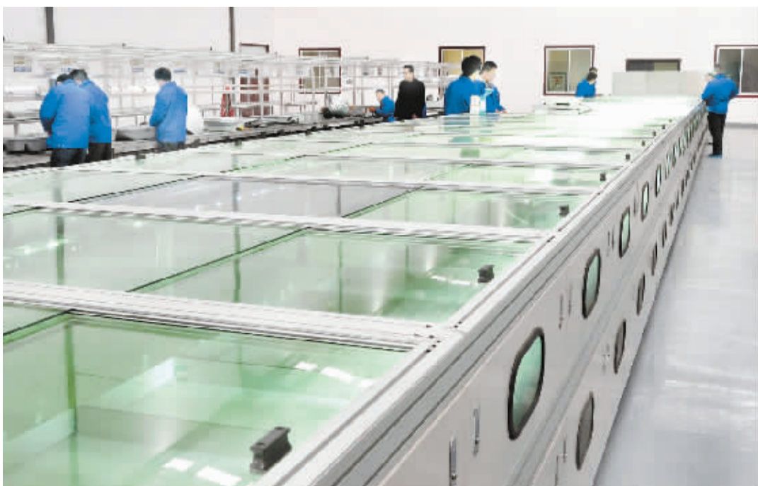
昨日上午，山光光电生产车间内的工人正在紧张工作。河南山光光电节能灯具生产项目，是市经济开发区引进的高新科技项目，同时也是我市唯一生产节能灯具的厂家。据了解，由于节能灯具比普通灯具可节能降耗 40% 左右，因此该项目产品在市场上具有很强的竞争力。

责，大胆负责。二是按照省委、市委政法委和市委的有关要求，把各项政法工作有序有效开展好，为平安周口、稳定周口、和谐周口提供良好法治保障。三是抓重点、促难点，抓要点、闪亮点，切实把平安建设抓出特色、抓出经验、抓出典型、抓出成效。四是创先争优，提级进位，树立形象，使我市政法工作有层次、有水平、有进步。五是加强领导，身先士卒，率先垂范，深入基层，抓点带面，打好基础，把政法各项工作做得更好、更扎实。