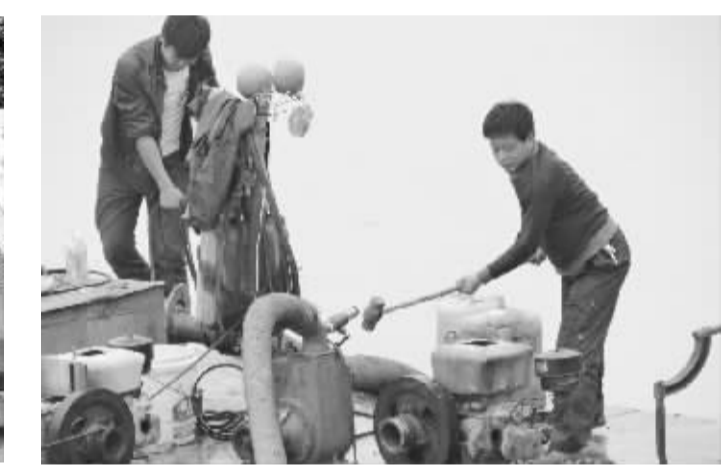
水利执法人员现场销毁非法采砂船只。

成效显著 自2012年下半年以来,全县共行政拘留非法采砂者9人,网上追缉3人。今年元月份以来,郸城