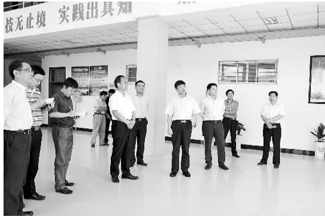
右图为陈启涛一行在西华县委书记王田业等的陪同下参观考察富士康西华实训基地。

在参观考察过程中,陈启涛一行对西华县产业集聚区的发展和重点项目建设留下了深刻印象,并对该县取得的成就表示祝贺。陈启涛说,河南与安徽相邻,皖北与周口交界,两省两地要加强沟通合作,相互借鉴,共同发展。要抓住建设中原经济区的历史机遇,借力发展,乘势而上,掀开携手筑梦的新篇章。