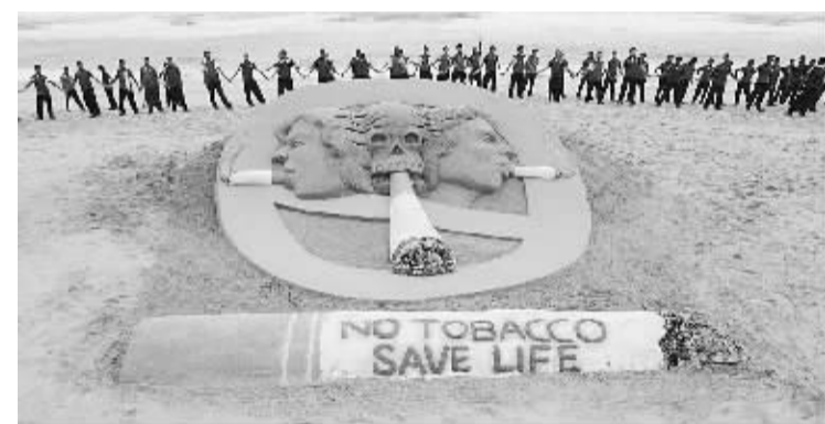
珍爱生命 远离烟草 5月30日,在印度布巴内什瓦尔,学生围聚在禁烟主题沙雕作品旁。5月31日是“世界无烟日”,今年的主题是“禁止烟草广告、促销和赞助”。连日来,世界各地的人们积极开展一系列宣传活动,希望通过广泛宣传让公众都知道烟草的危害,珍爱生命,远离烟草。

据新华社华盛顿5月30日电 美国国务院30日发布年度恐怖活动报告称,2012年巴基斯坦、伊拉克和阿富汗三国遭遇的恐怖袭击次数和伤亡人数最多。