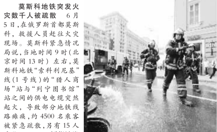
莫斯科地铁突发火灾 灾数千人被疏散

中国驻加纳大使馆提醒,旅加中国公民要遵守当地法律法规,合法经营,勿受网络不实信息误导。大使馆将协助有意愿回国的涉嫌非法采金中国公民有序撤离。