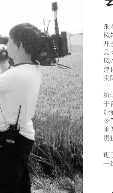
6月5日,河南电视台新闻中心走基层“三夏”直播报道组深入到商水县魏集镇天华种植专业合作社现场直播,宣传推介商水县开展院县合作共建农业科技成果项目示范基地新模式。

富资源优势十分看好,表示项目尽快于年底动工生产。县委常委、副县长荆涛对万汇集团和易木制品有限公司的到来表示欢迎,称赞秸秆制板项目选项好,是一项利国利民、变废为宝的好项目,表示要举全县之力把该项目扶持好、服务好、保障好,使项目