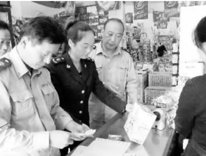
昨日,商水县白寺工商所对辖区食品经营户进行全面检查,为消费者把好“入口关”。“麦收”期间,该所出动执法车辆10台次,出动执法人员20余人次,设立12315服务台5次,检查食品经营户40多户,查处过期康师傅方便面20余桶,过期饮料10余桶,立案3起。