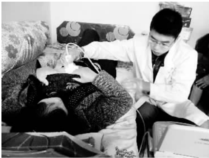
医务人员和平店乡敬老院为五保老人体检。日前,商水县计生、卫生、民政等部门积极组织,免费为全县农村五保老人、空巢老人进行了全面体检,送去了党和政府的关爱。

目前,该镇党员干部已结对帮扶困难户110户,帮扶机械50多台次,收割小麦360亩,种秋280亩,80%以上的秸秆得到综合利用,实现了全镇困难户“三夏”无忧。