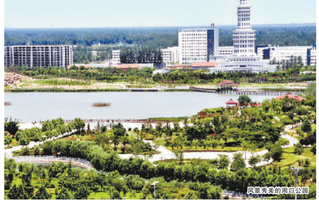
风景秀美的周口公园