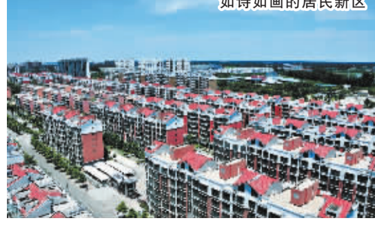
如诗如画的居民新区