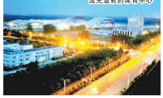
流光溢彩的体育中心