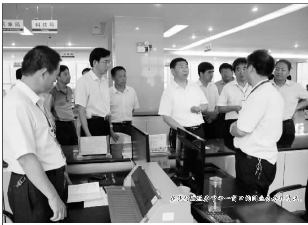
在县行政服务中心一窗口询问业务办理情况。

营造宽松环境,对干扰、阻挠项目建设的个人和事要依法严肃处理。施工单位要明确时间节点,统筹安排,科学谋划,精心组织,合理调度,规范管理,安全施工,加快推进,确保质量。 县委书记杨永志下达重点项目建设开工令。