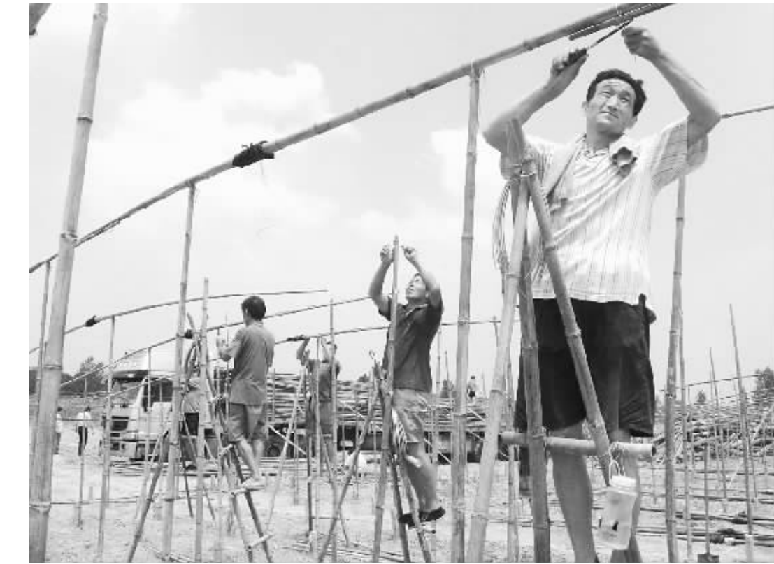
扶沟县江村镇早规划、早建设，力争雨季来临前建成40亩日光温室和10个巨型棚。图为建棚专业队冒着酷暑正在加紧进行棚体施工。

联系方式 市优化办:8238930 市行政效能监察中心:8229652 周口日报社:8282345 周口电视台:8380110 周口人民广播电台:8562608 中华龙网龙都论坛·民生关注栏目:8599555 市“转创”办电子邮箱:zksczb@163.com